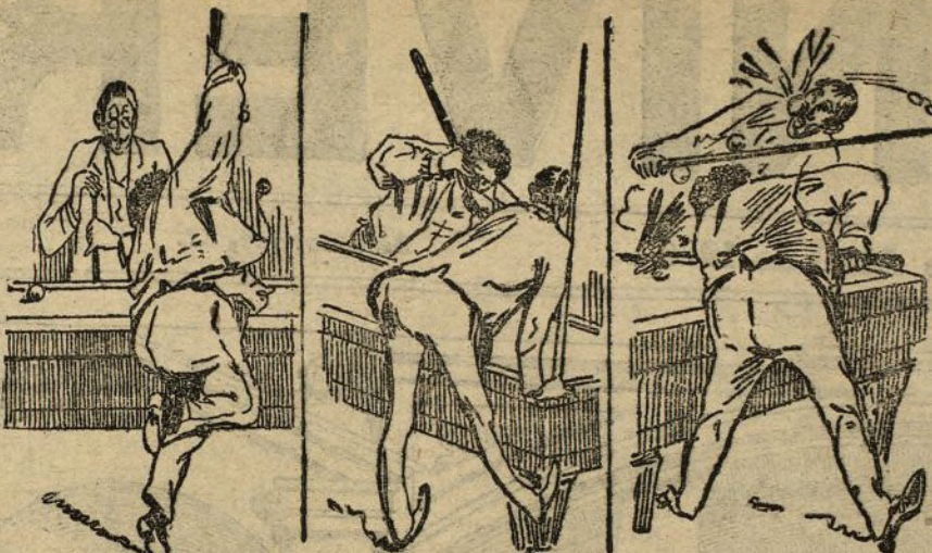
Una carambola difícil.

En cuanto a Marta, estuvo aquel día breves momentos en el Mesnil, y cuando después de haber abrazado a Jaime le fo-