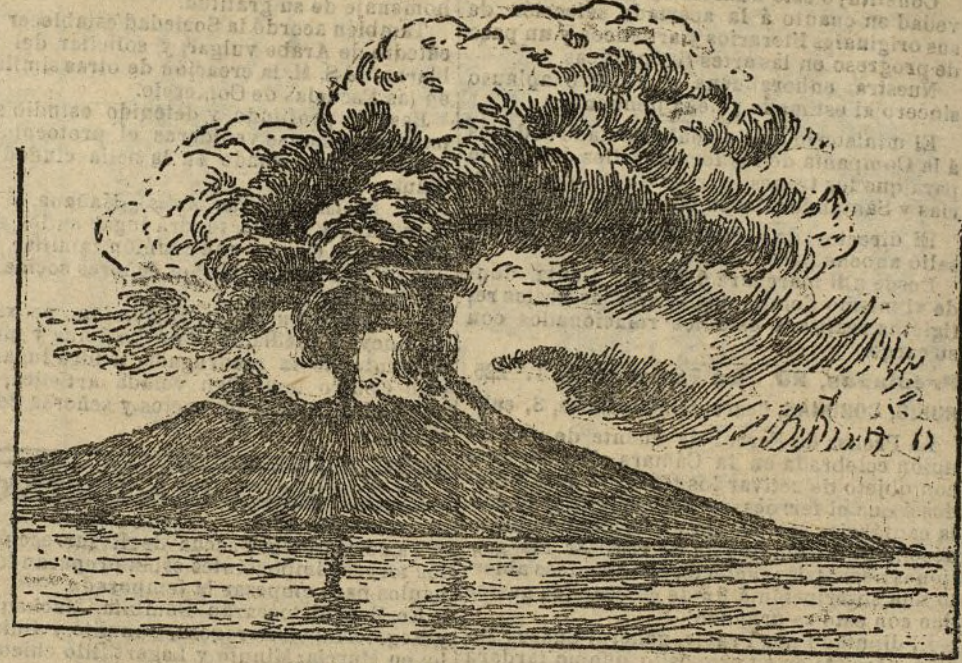
Vista del Vesubio en erupción