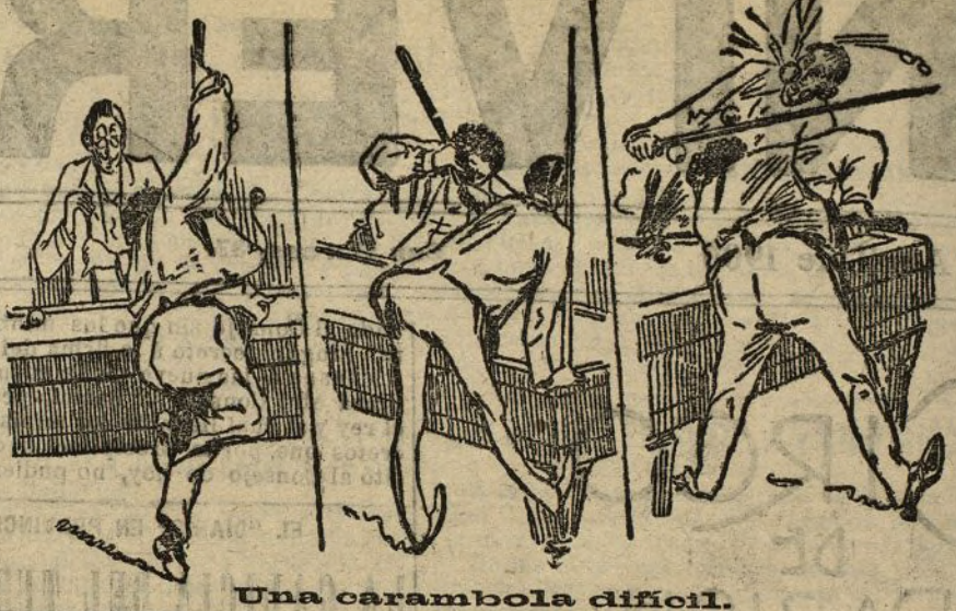
Una carambola difícil.