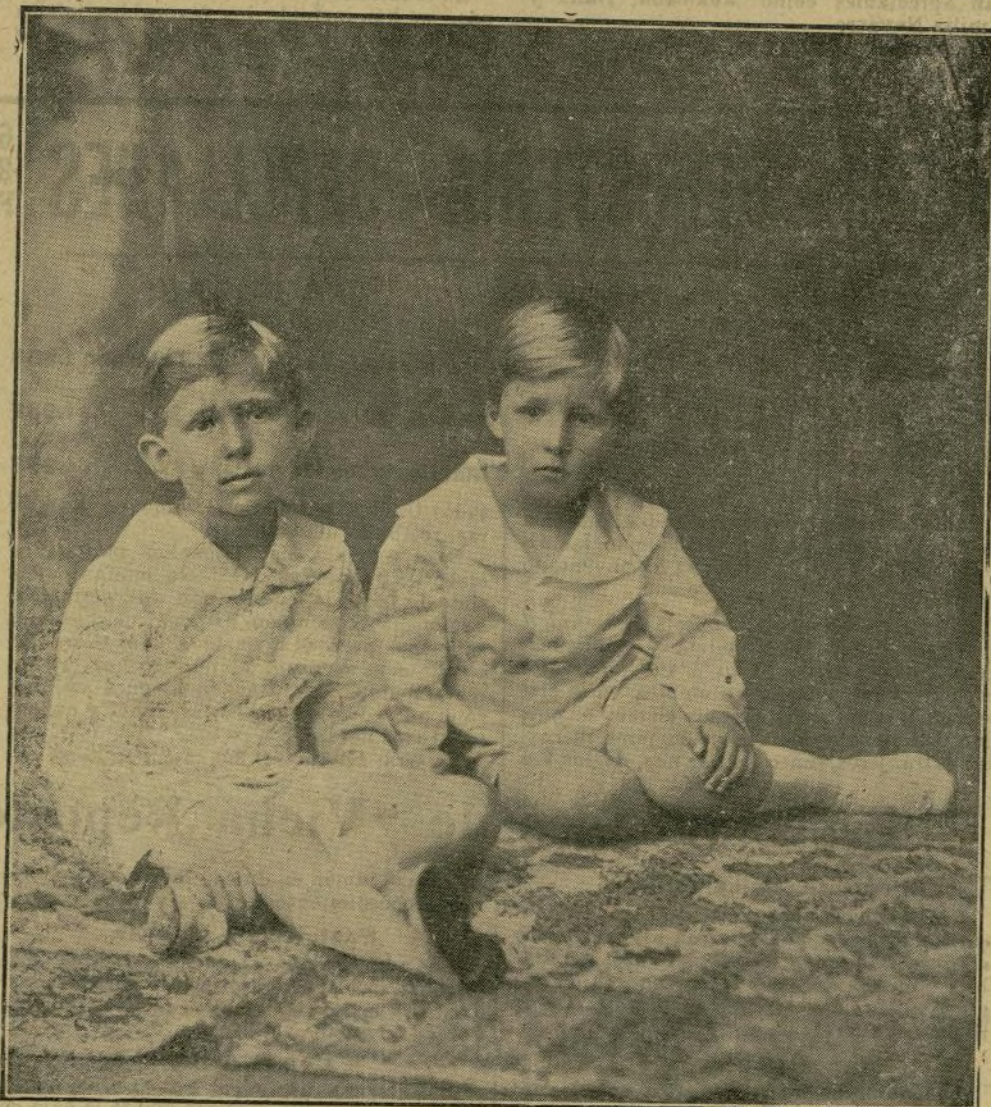
(Reciente fotografía obtenida por el notable artista Sr. Franzen.)