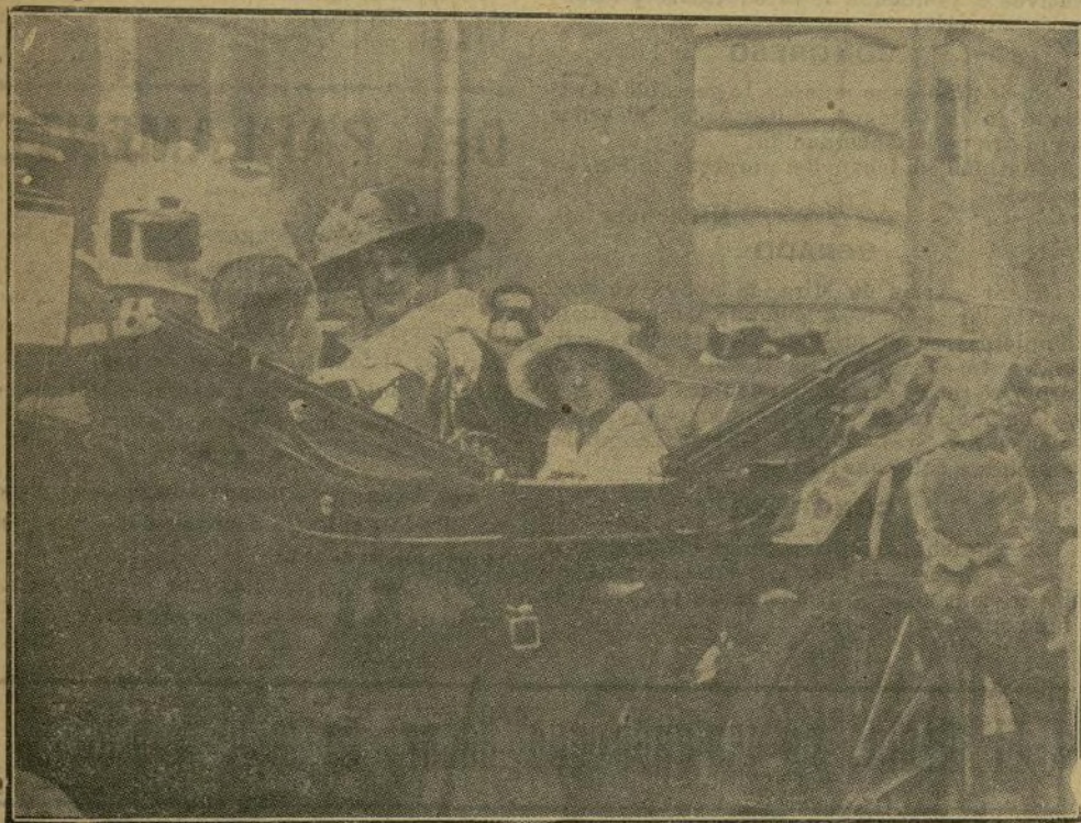
Llegada a Santander de la Soberana y sus augustos hijos.

Segunda.—Premio «Jockey» (vallas). Primero, 4.000 francos, «Rayo», de Cohn; segundo, 600, «Yunket», de Oyarzábal, y tercero, 400, «La Grise», del conde de la Maza.