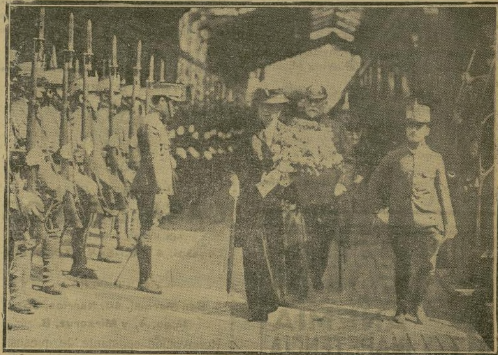
S. M. la Reina Doña María Cristina revistando las tropas que le rindió honores al llegar a la estación de San Sebastián.