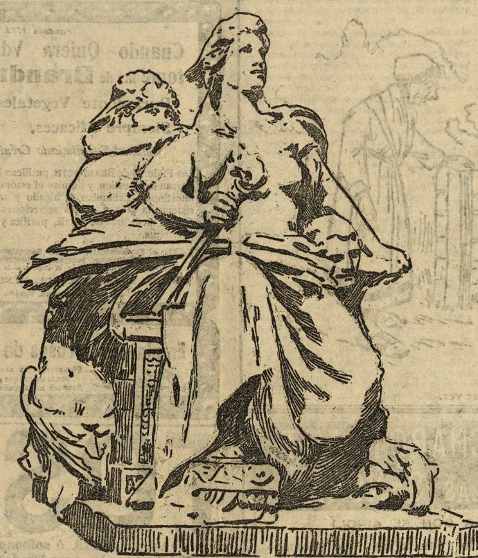
AMÉRICA.—Grupo alegórico que figurará á la entrada del Palacio de la Aduana de Nueva York