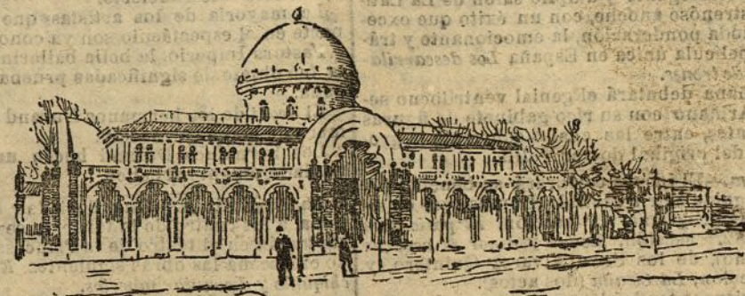
Vista del palacio de Madagascar

El emplazamiento de la Exposición Colonial de Marsella ocupa una extensión de 36 hectáreas.