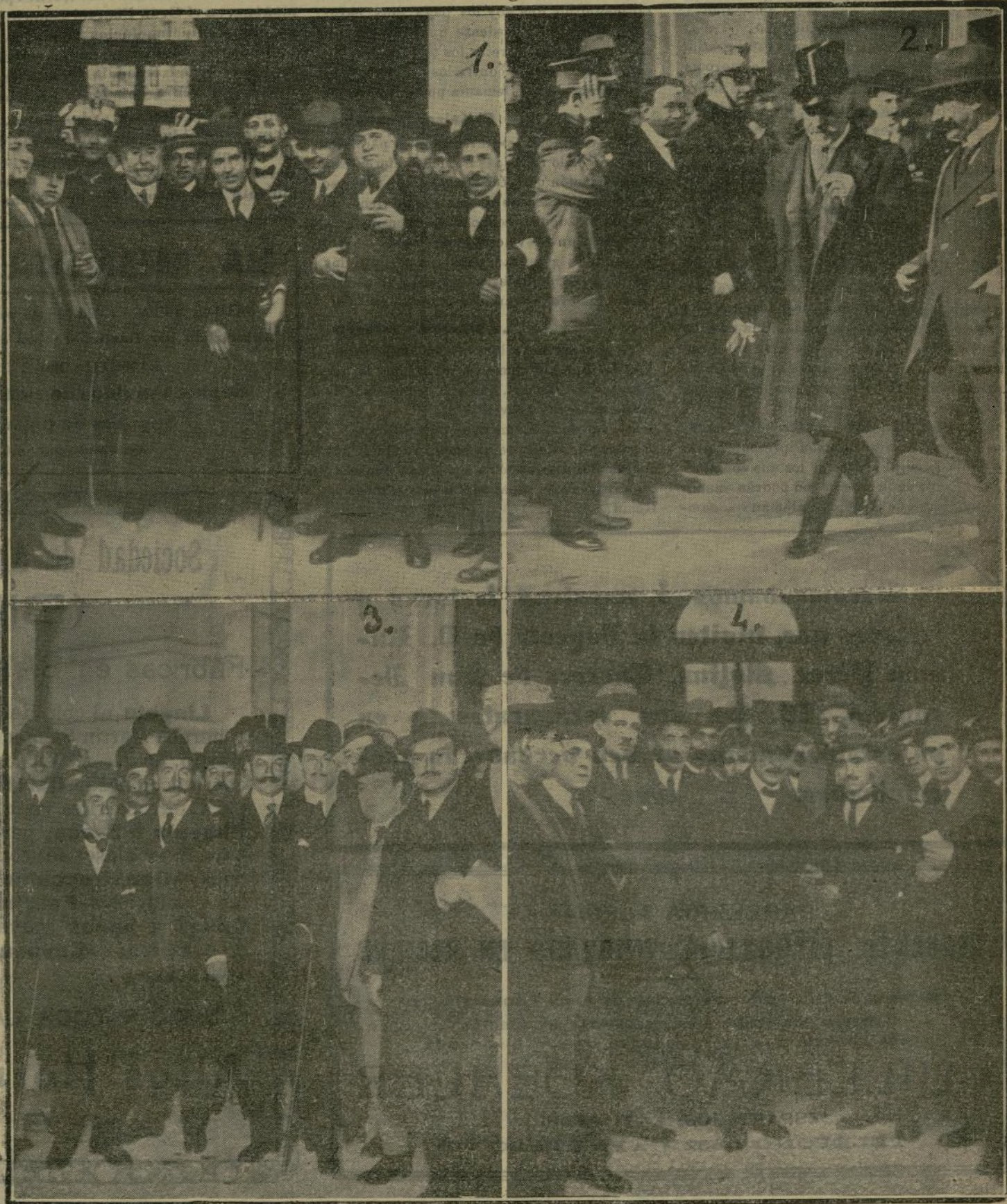
Los Sres. La Cierva, Villanueva, Sánchez Toca y Alvarez, saliendo de Palacio, después de ser consultados por Su Majestad.