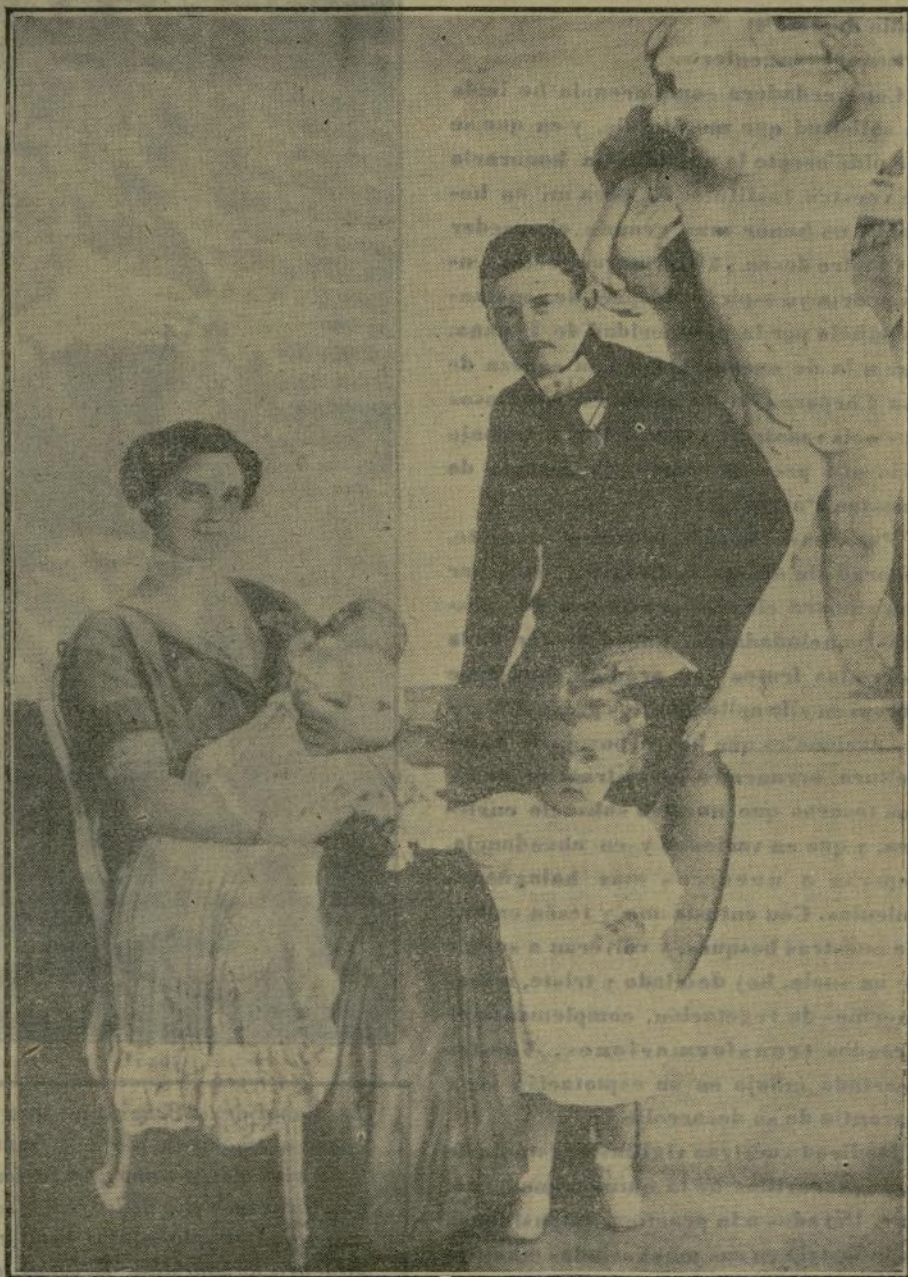
El emperador Carlos, su esposa la archiduquesa Zita de Borbón y Parma, y sus dos hijos el archiduque Francisco José y la archiduquesa Adelaida, cuyo paradero se ignora dadas las confusas noticias transmitidas acerca de la revolución en Austria.

Hay también un concepto erróneo respecto a esos elementos de defensa nacional. Los pacifistas entienden que la fuerza armada es una clase parasitaria cuyo fin e ideal es vivir a costa de la sociedad como casta supe-