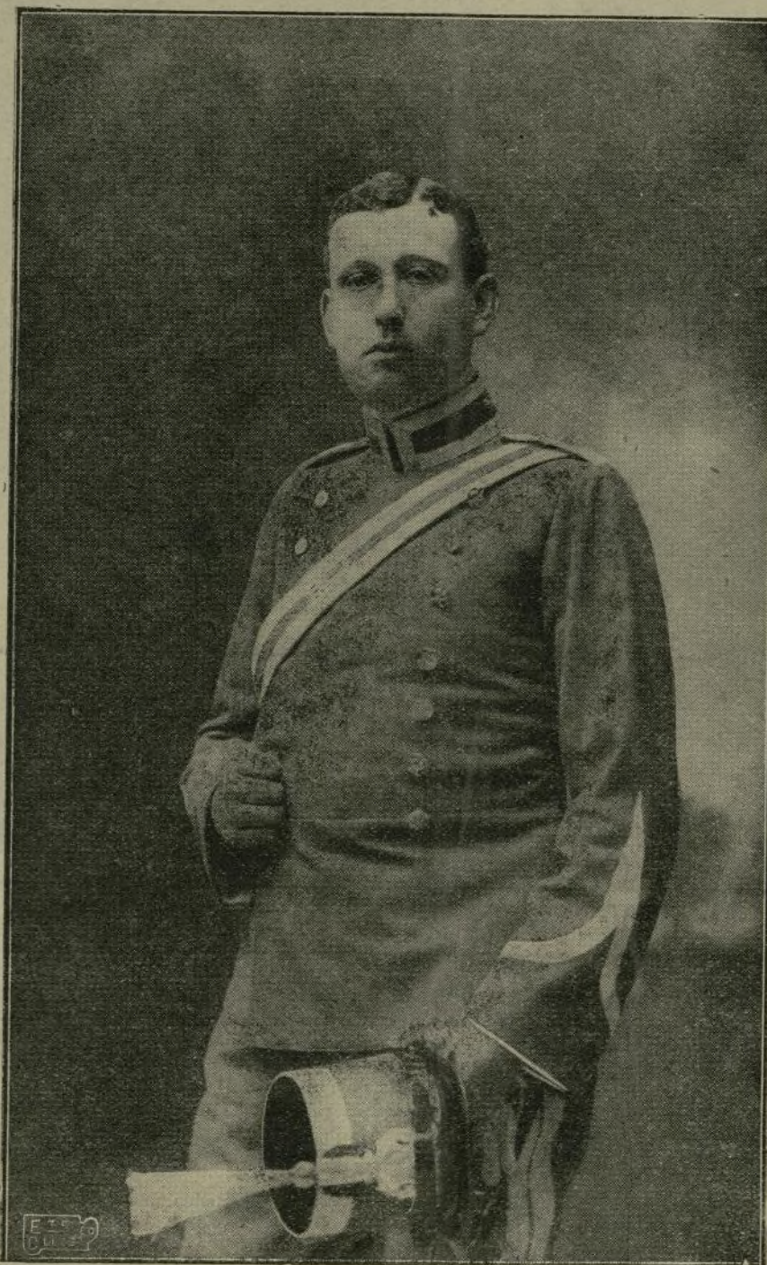
S. A. acaba de contraer matrimonio en París con la Princesa María Luisa de Orléans, hija de los Duques de Vendome. Nuestro Rey concedió a S. A. el Toisón de Oro.