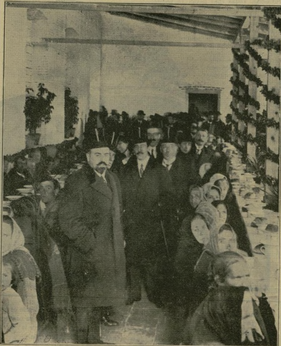
El Ministro de la Gobernación, D. Santiago Alba, inaugurando anteayer el comedor de caridad del distrito de Buenavista.

En primer término, he de dedicar a los señores conde de Sagasta y García Molinas el elogio a que se han hecho ambos acreedores