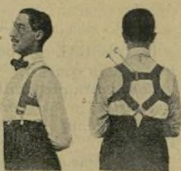
El Benefactor de espalda

Indispensable a toda persona que aprecie y practique la higiene en el vestir. Con el uso del TIRANTE-BENEFACCTOR las señoras conseguirán el desarrollo de sus senos, pudiendo prescindir así de medicinas y ungüentos perjudiciales muchas veces a la salud. — De venta en casa los Sres. Eduardo Schillina S. en C. (Barcelona-Madrid-Valencia) y al fabricante de ligas y tirantes «Smart».