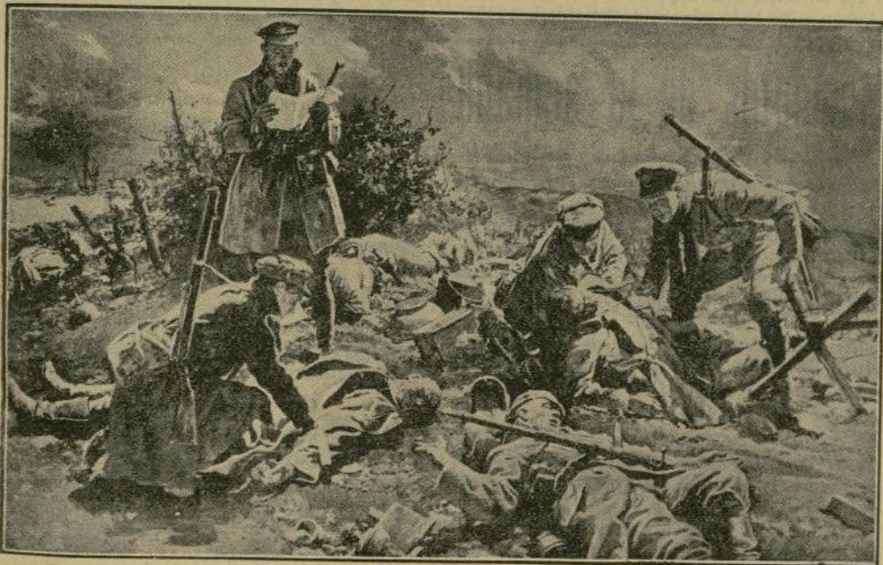
Después de ocupar una trinchera de alemanes, los soldados ingleses sanitarios van identificando los muertos.