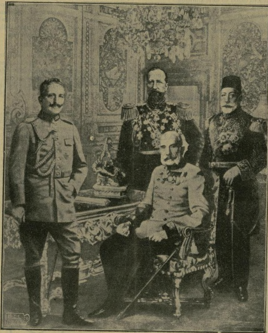
Interesante grupo en el que se hallan reunidos los Emperadores Guillermo, de Alemania y Francisco José, de Austria con el Zar Fernando, de Bulgaria y el Sultán de Turquía.

pueblos nos viésemos en igual circunstancia, análogas serían las manifestaciones e idénticas las efusividades. Errará, seguramente, quien crea lo contrario. Y a buen seguro que el alma española lamenta esta desigualdad geográfica, porque ella le impide patentizar de igual modo su respeto y su consideración a los pueblos que hoy luchan y se odian, sin que tan malas pasiones tengan acogida en su hidalga condición.