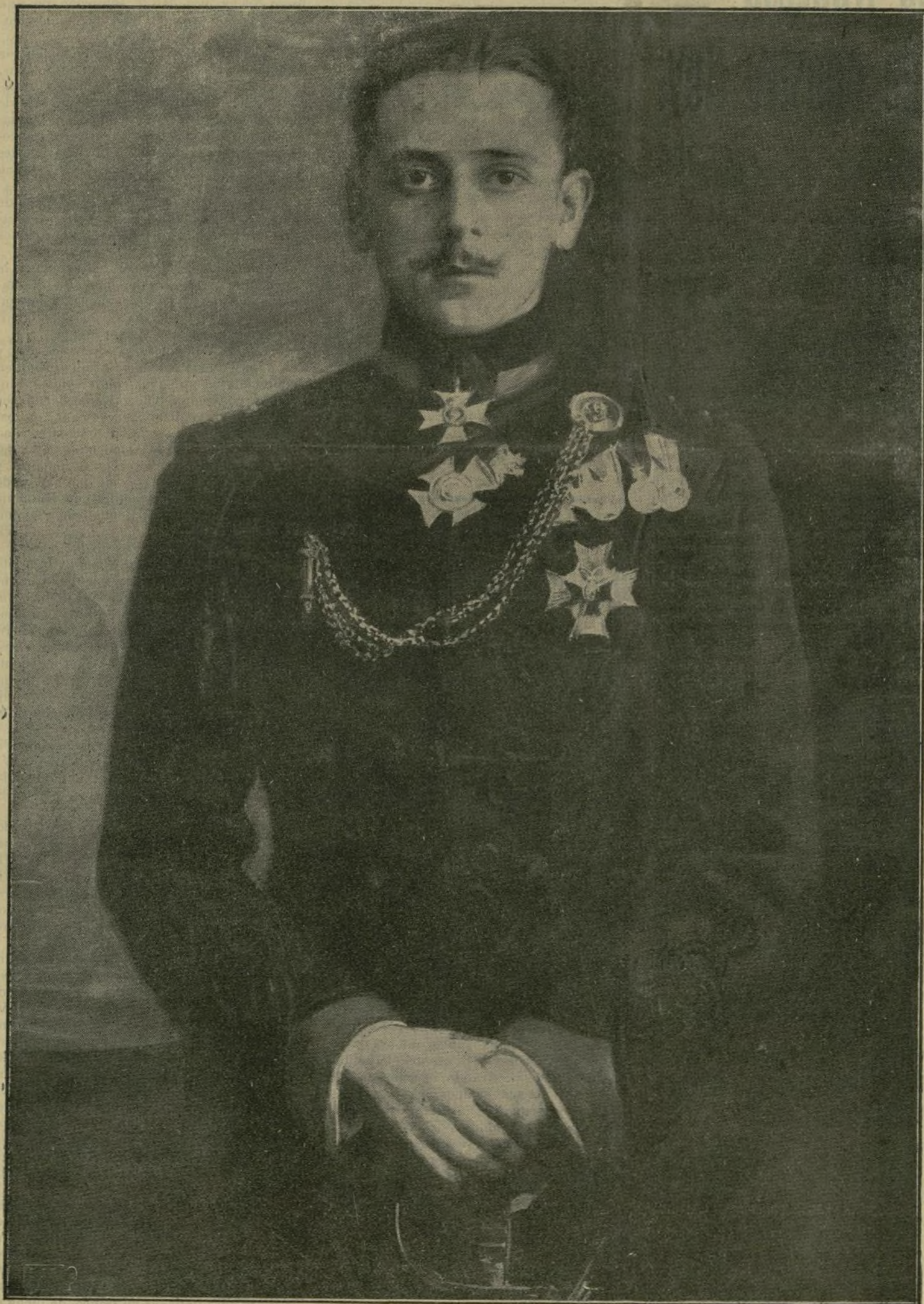
Copia del cuadro debido al pincel del ilustre artista Pabl Bejar.

—¿Que no servimos para nada los italianos? Ya lo verás ahora.