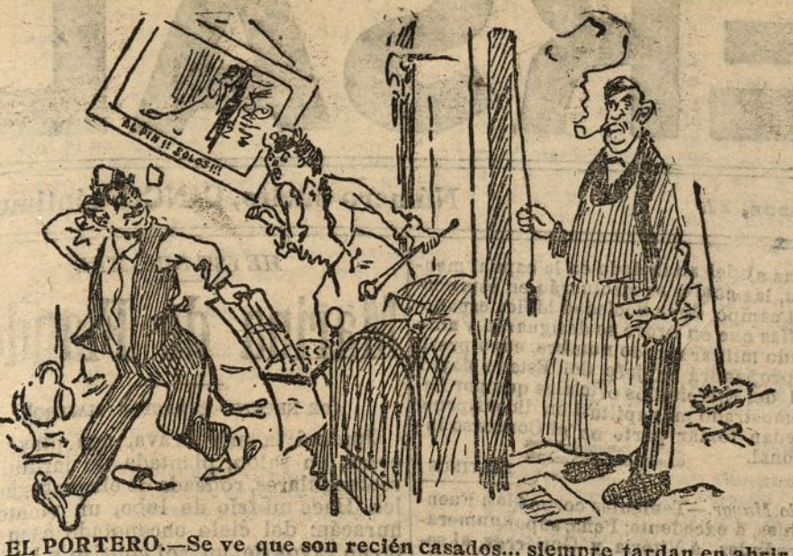
EL PORTERO.—Se ve que son recién casados... siempre tardan en abrir.