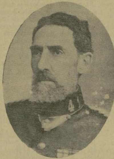
D. JOSÉ SANZ CORONEL DEL REGIMIENTO DE INFANTERÍA [DE GRAVELINAS]

que cuantos le integran sienten por su Patria y por su Rey. Ejemplos mil nos presenta la Historia, y una prueba palpable el estado de las naciones que intervienen en el actual conflicto europeo. Cifremos nuestras ilusiones todas en nuestro Soberano, que además de ser el ídolo de sus súbditos, ha llegado á causar la admiración del orbe entero, por su altruismo en favor de los heridos y prisioneros de las distintas