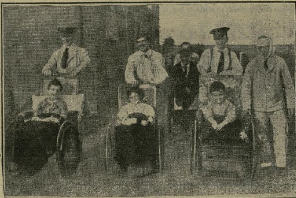
En un hospital de niños de Londres, los soldados heridos allí refugiados conducen los coches de los chiquitines enfermos.