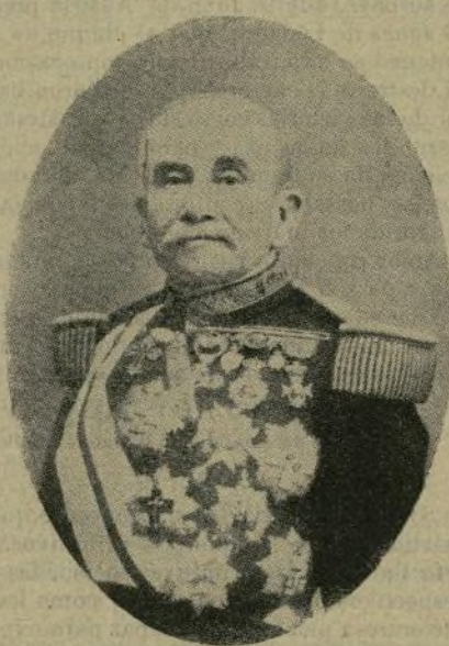
El Almirante Marqués de Pílares.