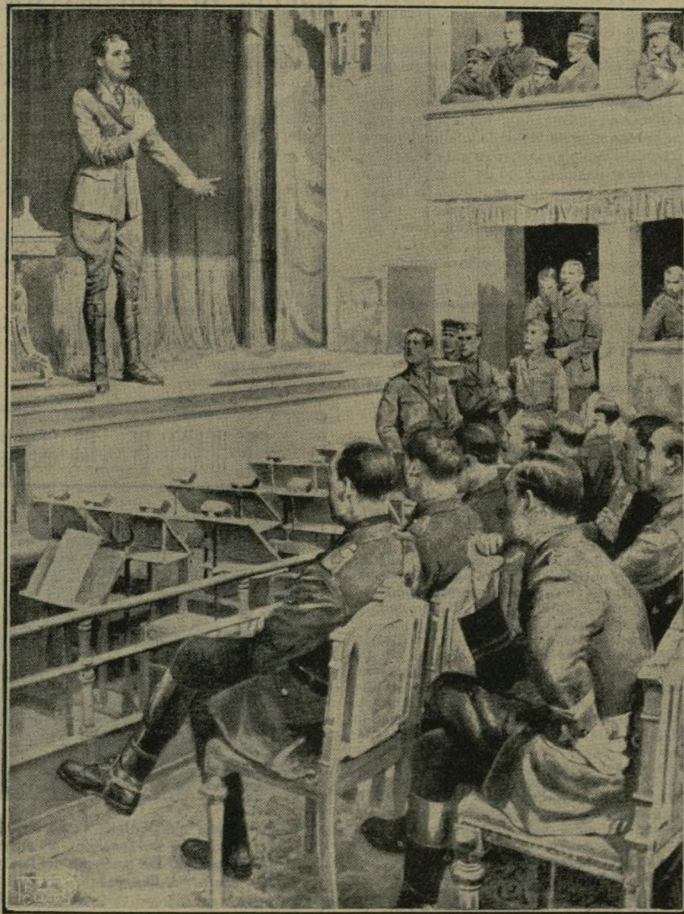
Conferencia dada por un oficial inglés a sus compañeros, acerca del servicio de exploración, en el teatro de una población próxima a las trincheras.

No necesita encomios el Sr. Luque, porque mostrada tiene su gran competencia parlamentaria. Sus palabras recogen las afirmaciones del conde del Serrallo para decir que muchas de sus leales advertencias serán atendidas. Agradece al general Weyler su breve discurso de conformidad, y defiende el proyecto con gran elocuencia de todas las impugnaciones que se le han dirigido.