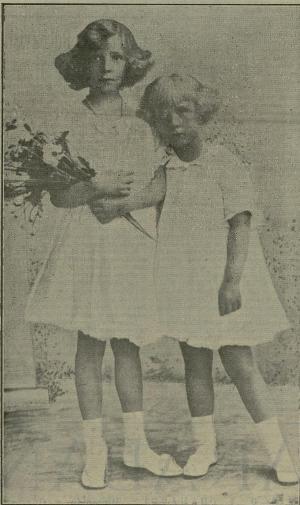
Sus Altezas las Infantitas Doña Beatriz y Doña María Cristina.