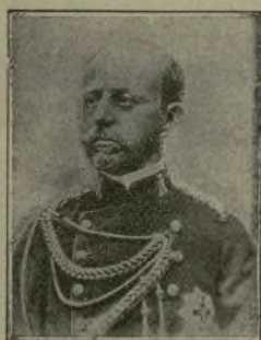
D r . D. Julio Cervera Baviera INGENIERO