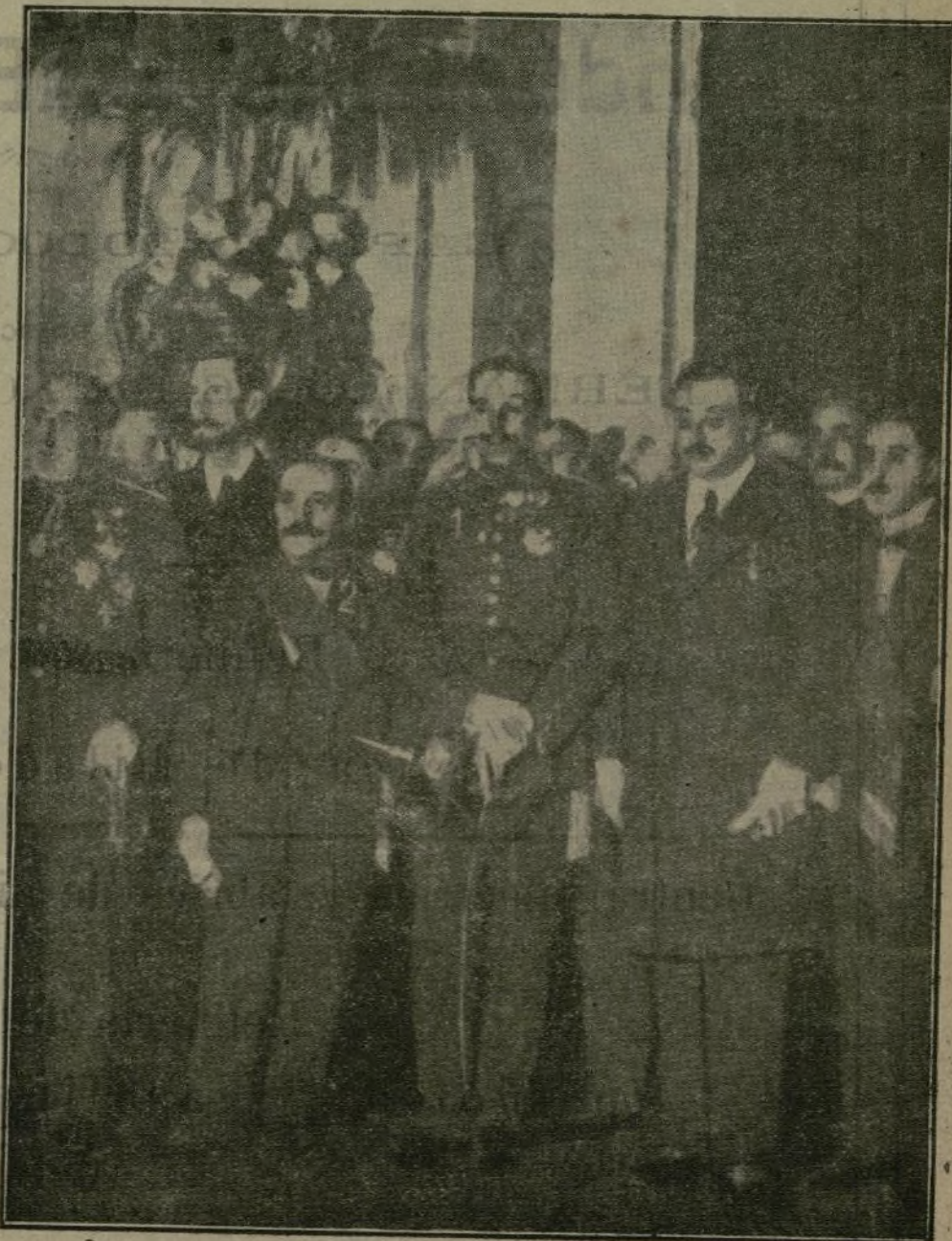
El Soberano después de imponer al alcalde de Zaragoza su representación a la capital aragonesa la medalla de oro del Instituto de Previsión.

Así es, y por ese camino habrá de llegarse y se llegará—confiamos, en que sea pronto—a la completa armonía de obreros y patronos; éstos interesándose por el bienestar y porvenir de aquéllos, que a su vez tienen también