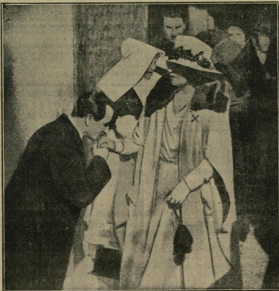
S. M. la Reina en el Hospital de Incurables, saliendo del benéfico establecimiento después de presidir un reparto de comidas a los pobres.

El Sr. Dato y el Sr. Maura en la cumbre, como políticos y como patriotas, estamos seguros de que sabrán cumplir sus altos deberes en pro de esa unión que tiene un eco de simpatía muy grande en todo el país.