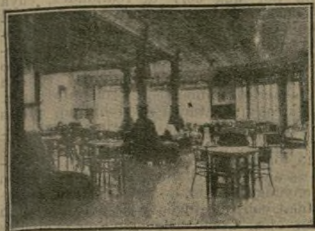
Detalle de uno de los salones del Círculo.

respecto, uno de los pocos que quedan y subsisten en España, a pesar de la transformación que ha sufrido la vida de los Casinos políticos.