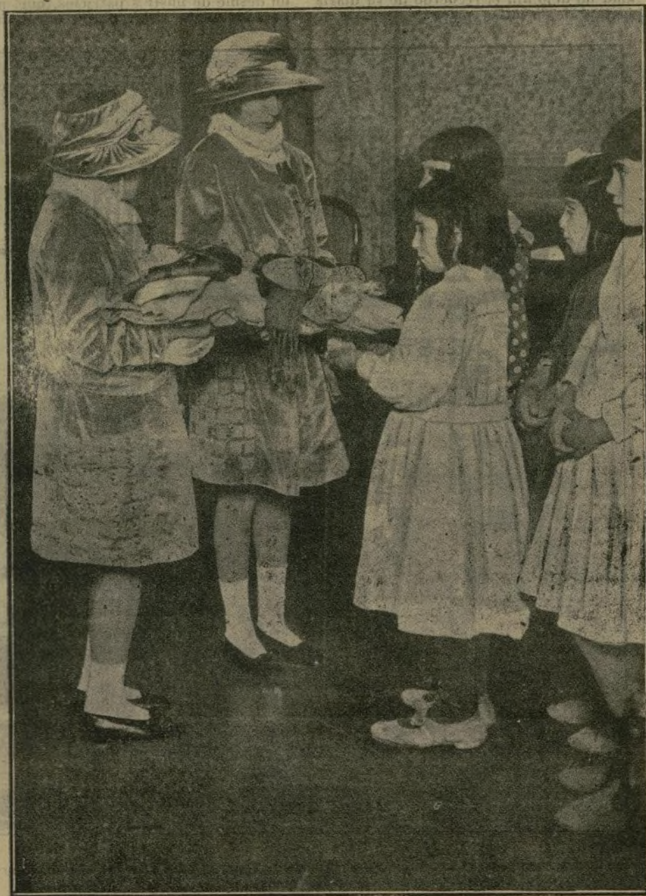
Las augustas hijas de nuestros Soberanos, repartiendo ropas a las niñas del Distrito

La inagotable caridad de nuestra hermosa Soberana no se limita a tomar