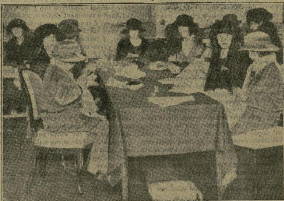
SS. AA. las Infantitas Doña Cristina y Doña Beatriz acompañadas por otras niñas de la aristocracia, cosiendo ropa para los niños pobres del Asilo de Santa Isabel

Al llegar el viernes entregan a siete niñas, en memoria de los Dolores de la Santísima Virgen María, otros tantos equipos completos, acompañando este hermoso acto de caridad cristiana de consoladoras palabras de afecto.