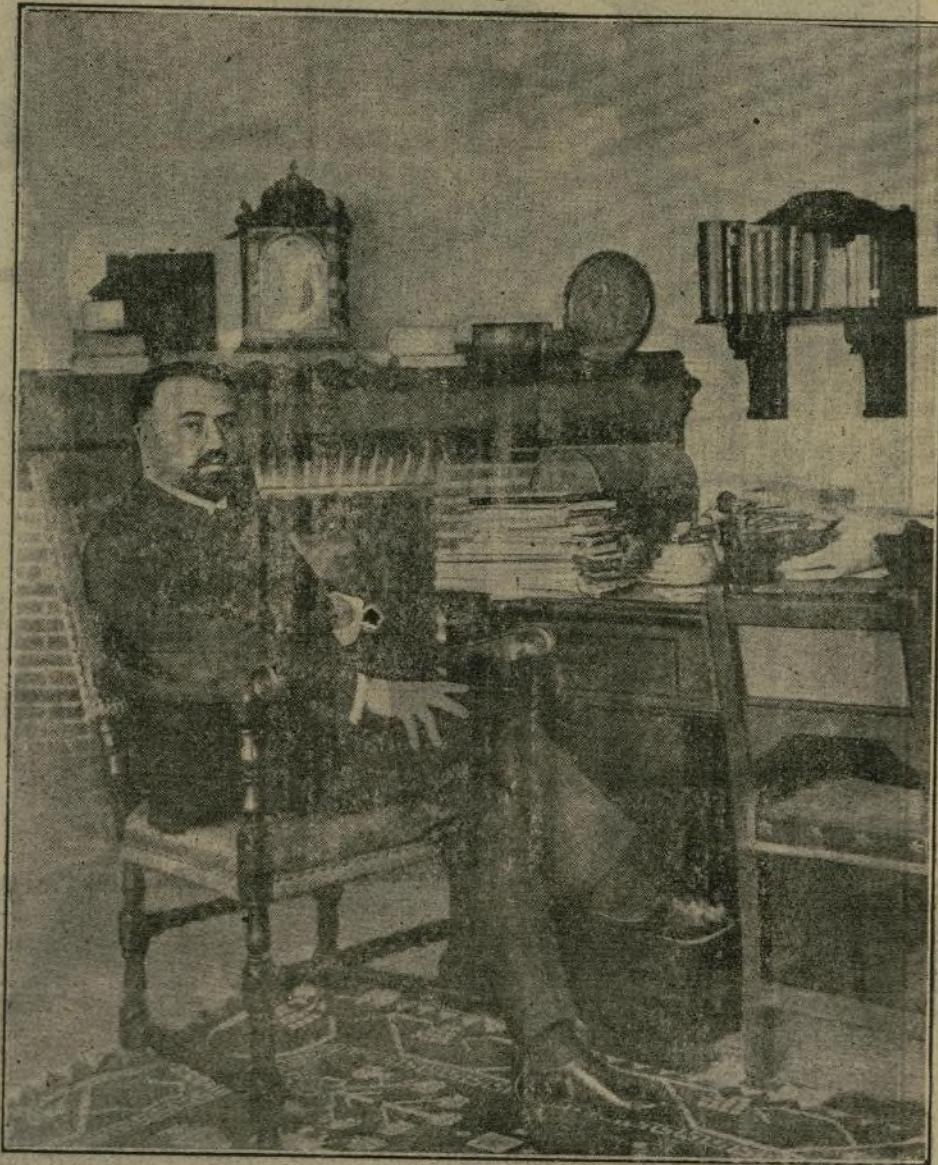
El ilustre exministro D. Santiago Alba, Presidente honorario del Círculo Liberal Monárquico de Valencia.

Toda su vida social no es otra cosa que un desfile de ilustres patricios, que, incorporados unos a la política en Madrid o