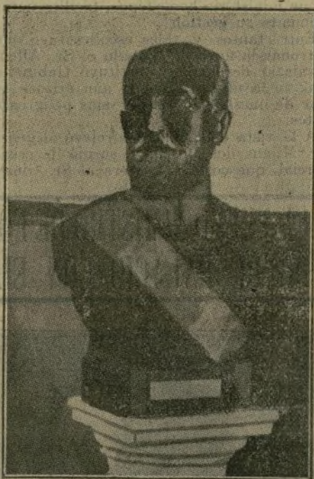
Busto de bronce que dedicó a D. Santiago Alba el Círculo Liberal Monárquico de Valencia.