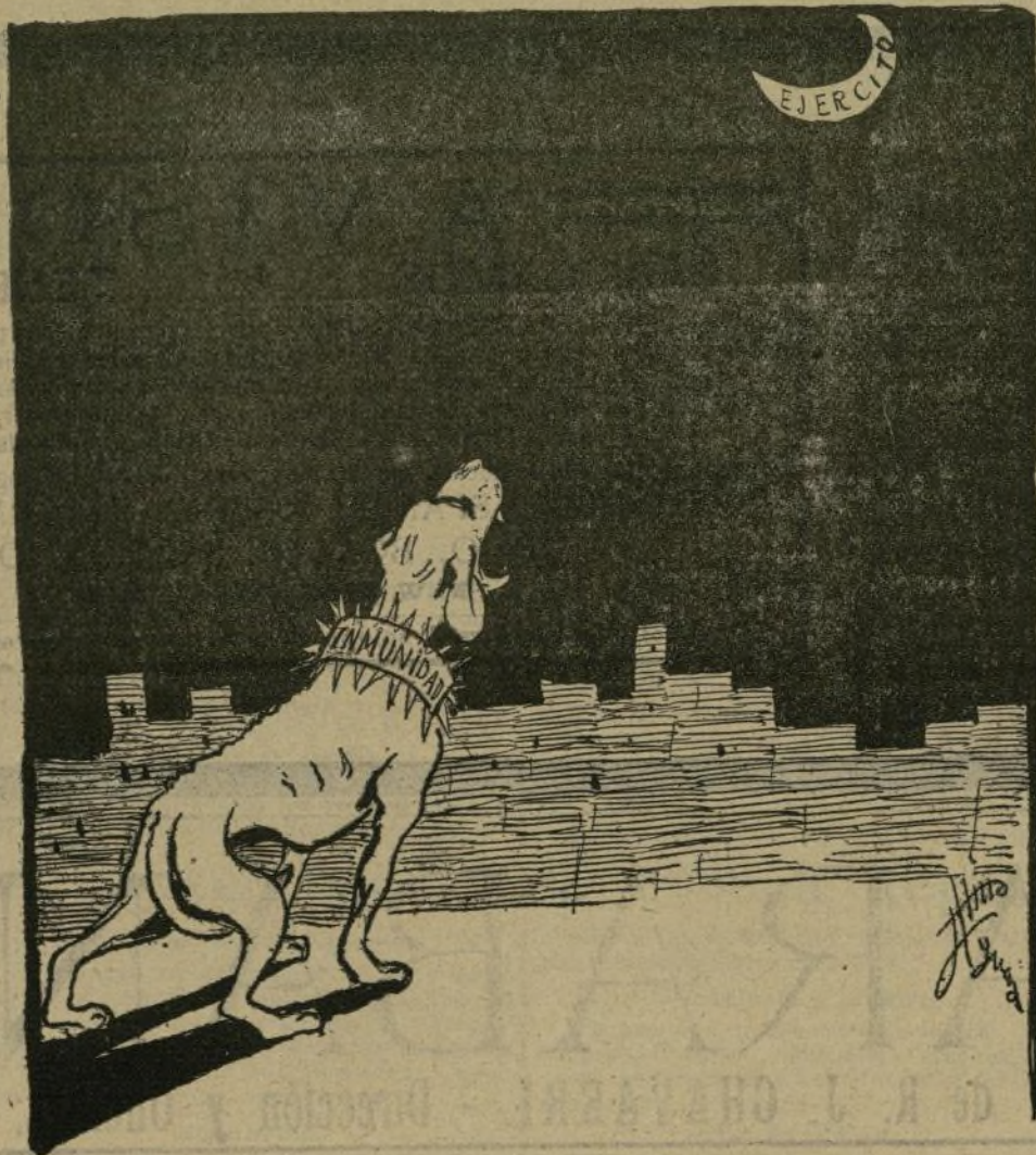
El perrito de la izquierda ladrándole a la Luna.