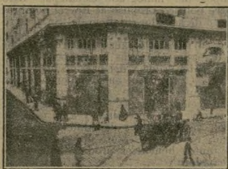
Vista parcial del magnífico edificio, en cuyos entresuelos se ha instalado el Círculo.

vida política y social. Tales son los fines de este Círculo y el medio en que se desenvuelve, y por esta sucinta narración pueden deducir nuestros lectores que es.