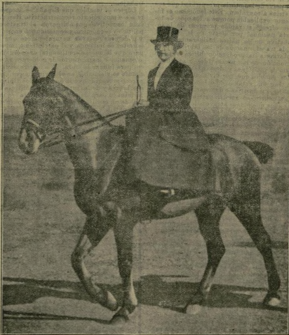
S. M. la Reina Doña Victoria, en una cacería recientemente celebrada en la Venta de la Rubia.