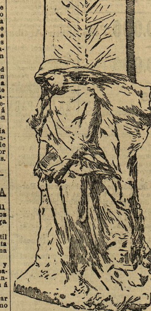
FIGURA DE LA HISTORIA.—Sepulcro de Cánovas

pecho, sostenían el crucifijo. La cruz la conservaba tan aferrada entre los dedos, que no se le pudo quitar para cambiarla por otra más artística y valiosa. Los concurrentes, emocionados, pregonaban la escena. Los restos fueron cuidadosamente envueltos en un paño blanco y depositados luego en la nueva caja que es de plomo y va encajada en otra de caoba maciza con herrajes de plata. Antes de cerrar el nuevo féretro se pusieron flores en él. El féretro quedó ayer depositado en la cripta del panteón, hasta hoy en que se verificará el traslado al panteón de Atocha.