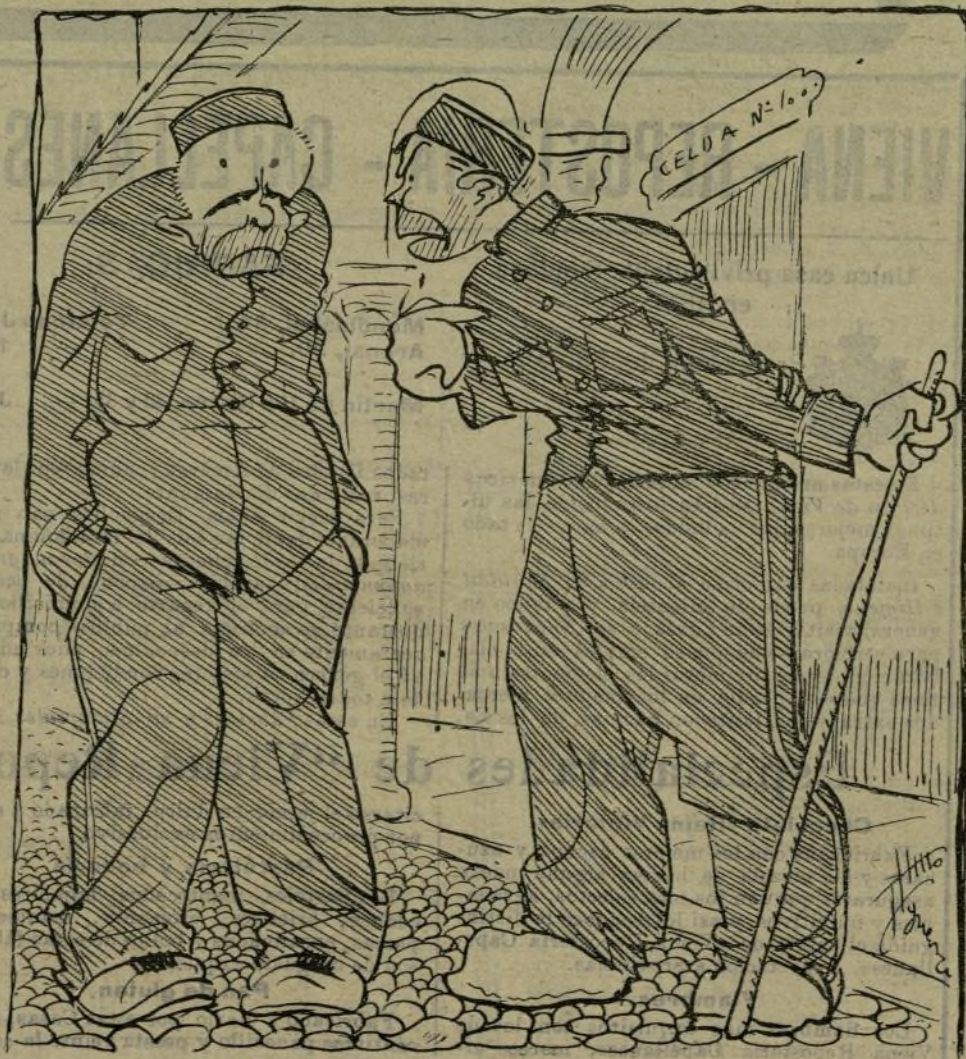
—La comisión para el arreglo de todas estas cosas de reclusos se asesorará de los técnicos u sease de nosotros.