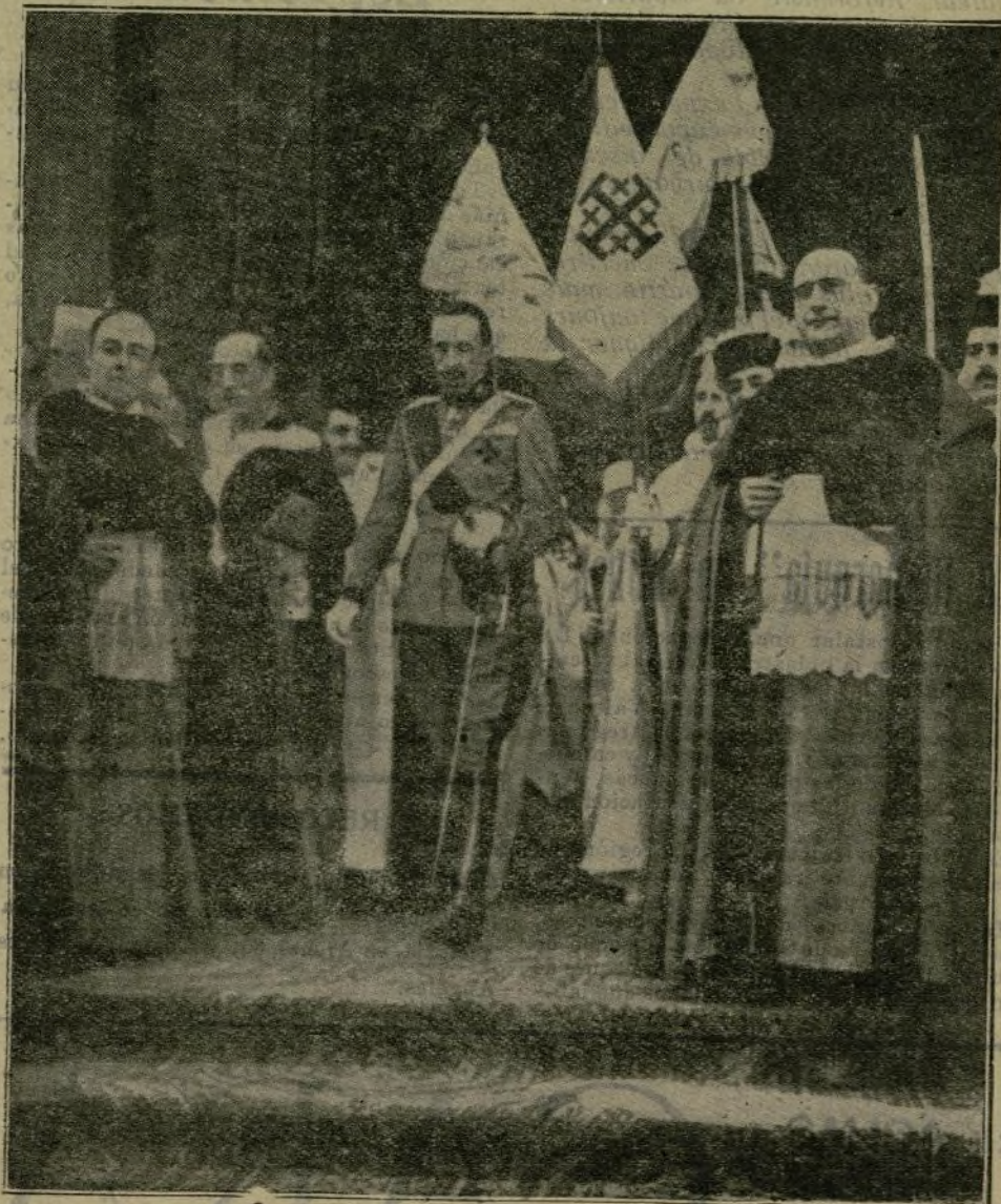
El Soberano, al salir de San Francisco el Grande, después de la ceremonia de la entrega del nuevo estandarte de los caballeros del Santo Sepulcro.

A cause de la cordialité fraternelle qui nous unissent a Portugal, nous regrettions vraiment les maux qui souffrent la voisine République, et nous