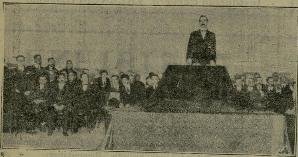
El vizconde de Eza, presidente del Instituto de Reformas Sociales, dando su interesante conferencia sobre el problema social.

Bien claramente, pues, se manifiesta la provechosa gestión del Gobierno del señor Allendesalazar tanto en la labor parlamentaria cuanto en el restablecimiento de la paz de Barcelona.