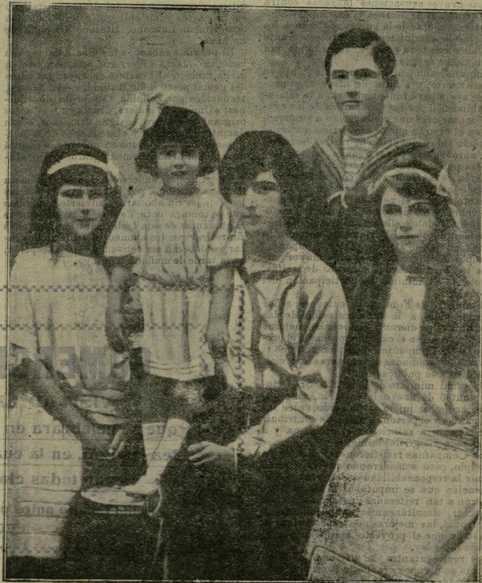
Fotografía reciente de los augustos hijos de los Reyes de Italia.

La France et l'Angleterre, au ont beaucoup à faire, à prévoir et se préparer si ce triomphe s'affirme.