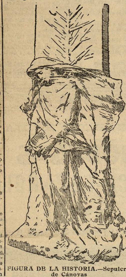
FIGURA DE LA HISTORIA.—Sepulcro de Cánovas

con justicia se le conceda la recompensa merecida por su labor y su talento. Agustín Querol, que ha obtenido premios de honor en Exposiciones extranjeras, donde se ha unido un poco más delgado en arte, y sobre todo en escultura, es acreedor a que se le conceda en su país distinción tan justa como ganada.