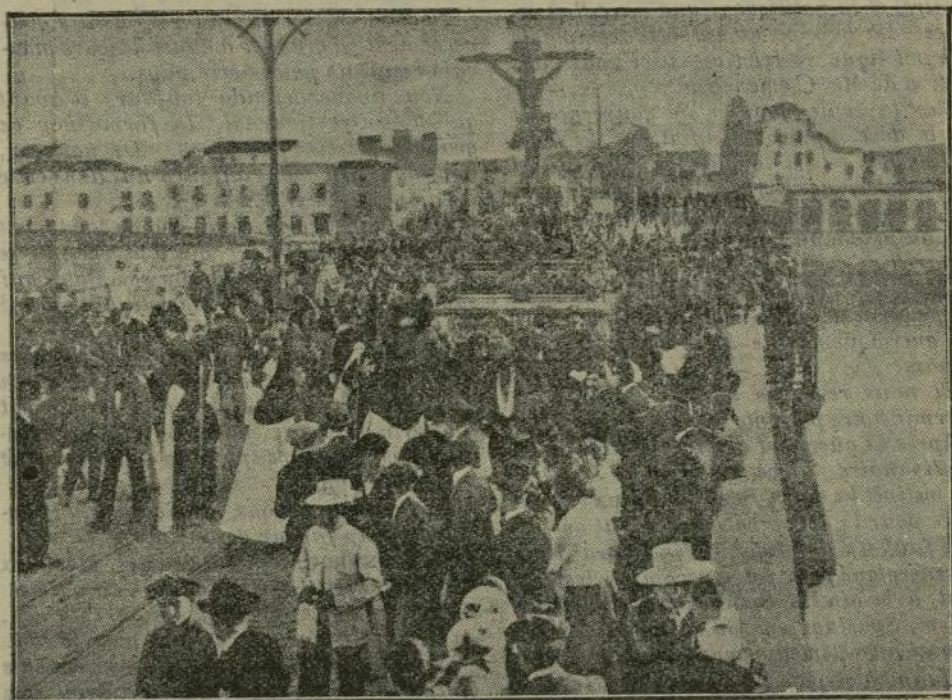
La Imagen del Santo Cristo de la Expiración del Barrio de Triana, en Sevilla, al pasar por el puente de Isabel II

No es la hora de las izquierdas aquí ni fuera de España, sino de los partidos que representan el máximo acata-