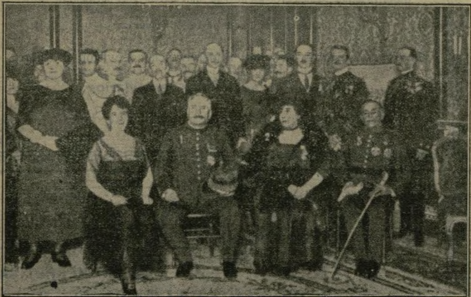
El Mariscal Joffre (1) y su esposa (2), con el Ministro (3) y su esposa (4), durante la recepción celebrada en el Ministerio de la Guerra.

—Le Maréchal pendant son bref séjour a Madrid a pu éprouver la grande sympathie que la nation espagnole a eue vers la République victorieuse, et pour tous ses savants et illustres personnalités. Au banquet offert par S. M. Le Roi à Mr. Joffre, et dans