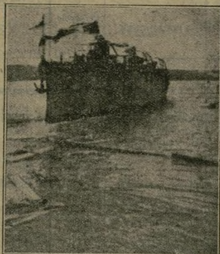
El crucero después de la botadura.

oceánicas... A los acordes de la Marcha Real, interpretada por diversas bandas militares, el enorme casco del crucero internábase en el agua, surcada por una nube de vaporcitos que tocaban sus sirenas, en tanto rasgaban el éter cohetes y en las tribunas, llenas de una distinguida concurrencia las toaletas femeninas y los uniformes ponían una nota gayá al cuadro... En el instante de ser soltadas las amarras y deslizarse sobre las planchas engrasadas la nave, plena de majestad, luego de inclinarse de proa como saludando al mar hubo como