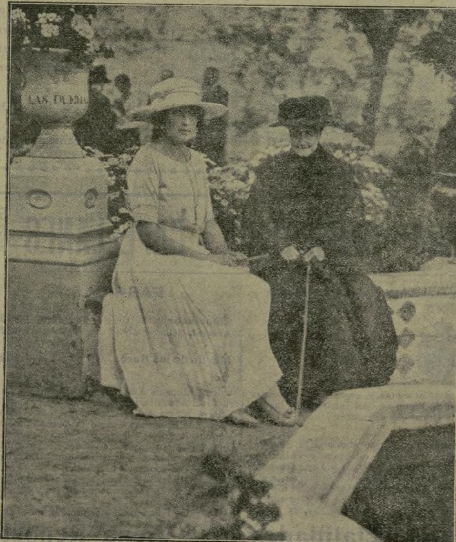
Interesante fotografía de S. M. la Reina Doña Victoria acompañada de la ex Emperatriz Eugenia, en el jardín del Palacio de las Dueñas, propiedad del Duque de Alba. Grupo augusto de una egregia dama, aureolada por el doble prestigio de la ancianidad y la realeza, y una joven Soberana, en quien la belleza es también nimbo y gala suprema. S. M. la Reina continúa en Sevilla, donde constantemente recibe los respetuosos y entusiastas homenajes del simpático pueblo andaluz.