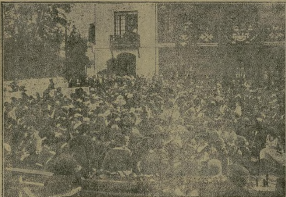
Aspecto del parque de «Parisiana» durante el festival presidido por la Soberana y sus augustos hijos.

El público tributó a la Reina entusiasta y cariñoso recibimiento.