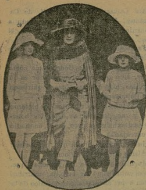
S. M. la Reina con las Infantitas al llegar a Parisiana.

Actuando en Parisiana hay siempre notables artistas, que prestan encanto al lugar y hacen agradable la estancia en el Círculo.