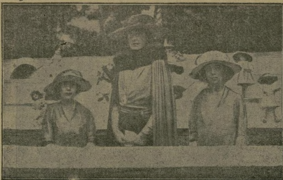
S. M. la Reina con sus augustas hijas viendo la Exposición de muñecas.