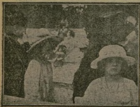
SS. MM. Doña Victoria y Doña Cristina, con las Infantitas, viendo las muñecas y abanicos.