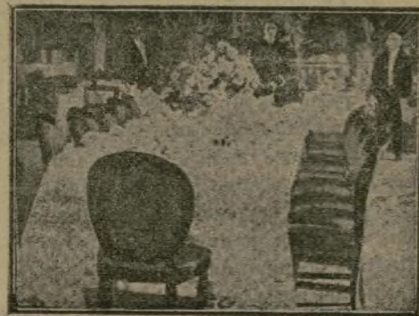
Comedor dispuesto para las personas de la Real familia, en la fiesta de Parisiana.

Parisiana es el más elegante y aristocrático establecimiento de Madrid; es