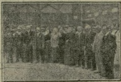
Obreros condecorados por el Soberano con cruces de Isabel la Católica, y que llevan más de cincuenta años en la fábrica.