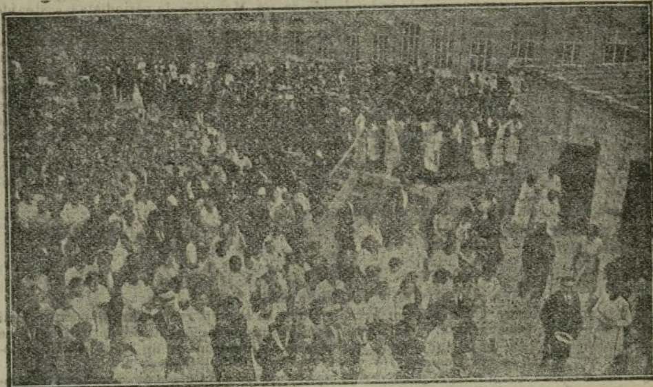
Los obreros en el patio de la fábrica, ovacionando entusiastamente al Soberano.

obreros de la Compañía y que se hallan jubilados pues que la entidad Fabra y Coats, poseedora de cinco grandes fábricas, con cerca de tres mil obreros a su servicio, tiene establecido el sistema, que la honra, de pagar jubilaciones.