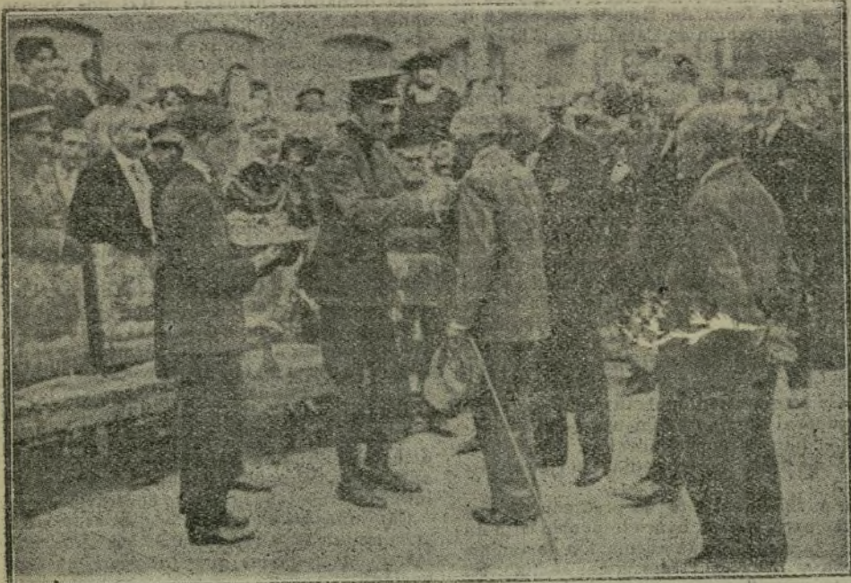
El Monarca imponiendo la cruz de Isabel la Católica a uno de los obreros que lleva más de cincuenta años de servicios en la fábrica.

La lealtad y la gratitud con que los honrados trabajadores de Fabra y Coats corres-