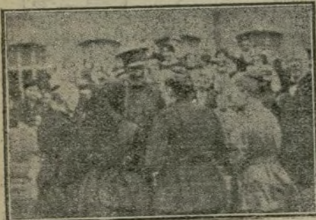
Las obreras de la fábrica que llevan más de cincuenta años de servicio, conversando con S. M.

llevan prestados más de cincuenta años de servicio, fué realmente emocionante Su Majestad impuso por sus propias manos la cruz de Isabel la Católica a nueve ancianos obreros, modelo de honradez y laboriosidad