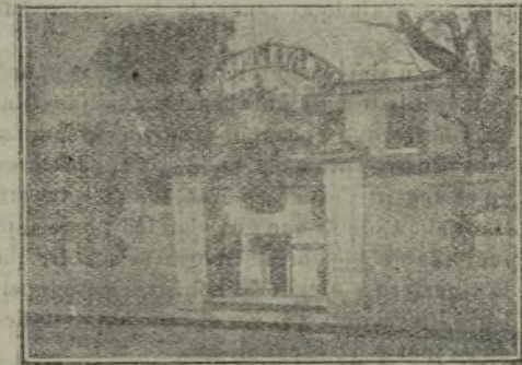
El Palmarium Casino, de Tánger.

Al recorrer las enormes dependencias de esta gran Casa pudimos observar una intensa actividad comercial, que contrastaba con el sereno reposo que hubimos de respirar en su claro y amplio salón de la planta principal, donde actualmente celebra la Exposición de sus cuadros un notable pintor, creemos que polaco, detalle de arte y de buen gusto que completa las iniciativas de una gran Casa montada a la moderna.