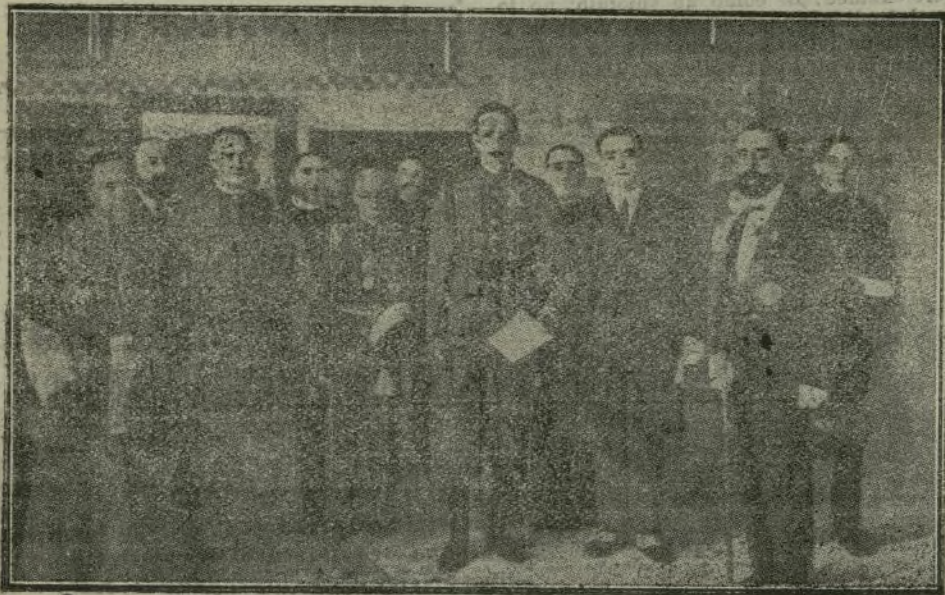
El Soberano después de pronunciar su discurso en Pamplona.

Habéis distribuido con gran tino vuestra atención entre los problemas de orden cultural y los de orden económico que constituyen la suma preocupación de todos en el momento presente, y por lo que me ha sido ya conocer de los trabajos que han constituido el Congreso, creo que predomina en todos ellos aquel espíritu práctico que es caracte-