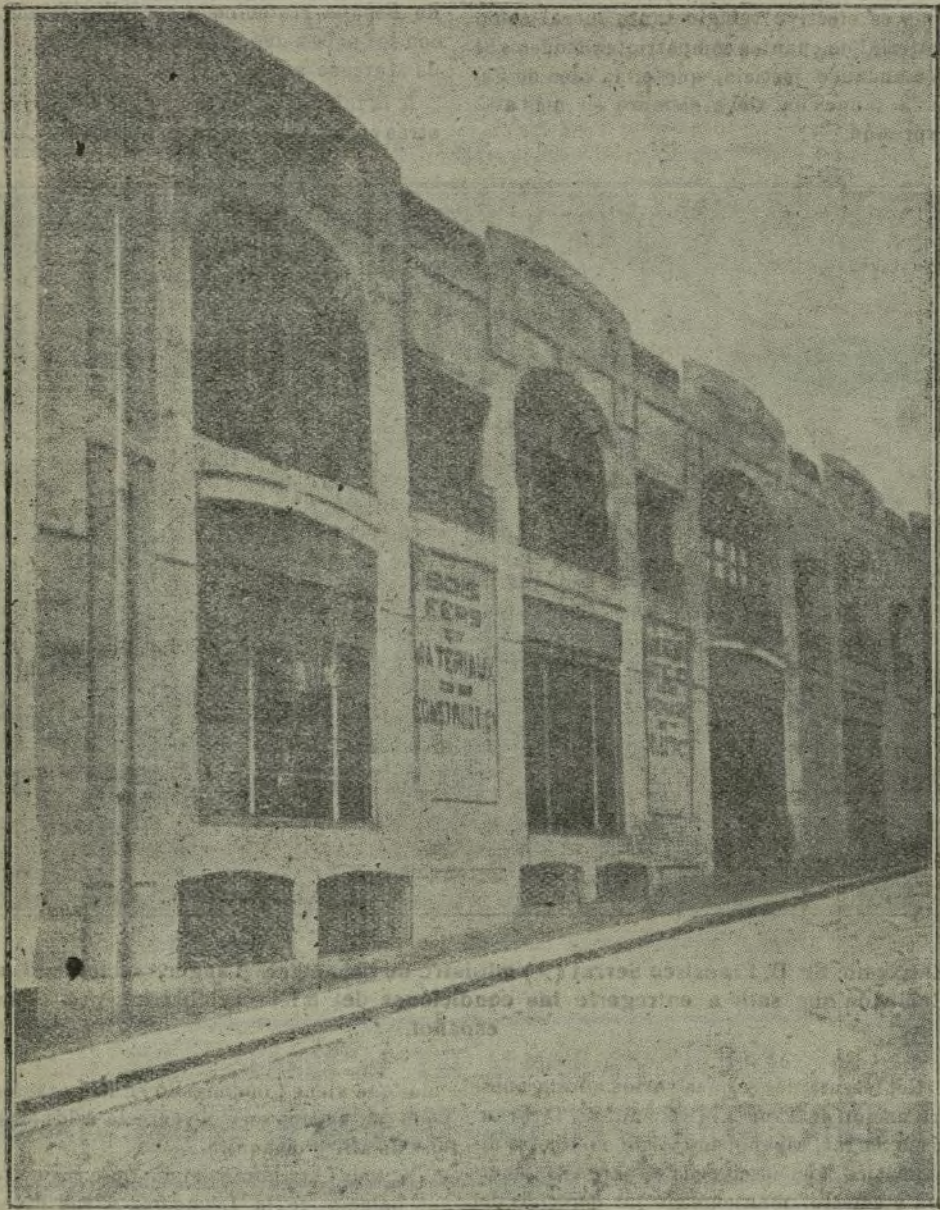
Fachada de la Casa Dahl en Tánger.

Fué fundada esta Casa en 1895, y tiene su