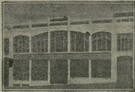
Fachada de la Casa española Orbea y Compañía, en Tánger.

Se ocupa esta casa en la venta de una porción de artículos distintos: ferretería, materiales de construcción, maquinaria agrícola, muebles, batería de cocina, material eléctrico, pinturas, material sanitario, etc., etc. Puede decirse que allí se encuentra de todo. Estos grandes almacenes españoles, orgullo de Tánger, están instalados en un enorme