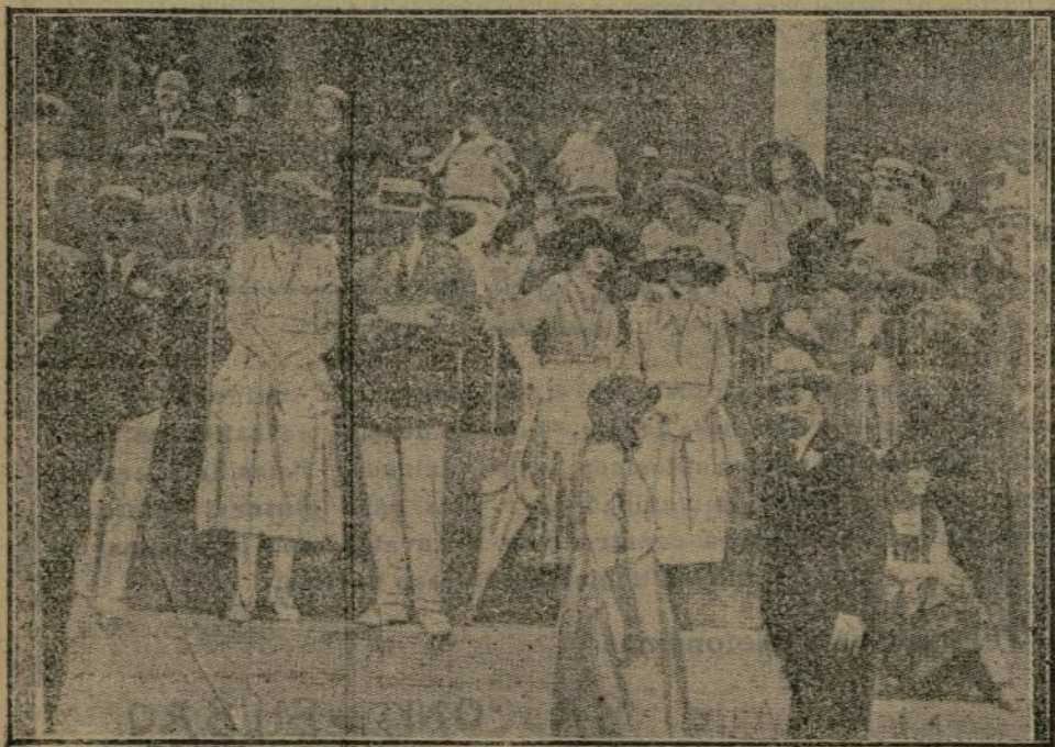
El público en las tribunas del Hipódromo de Lasarte el día del «Gran Premio.»