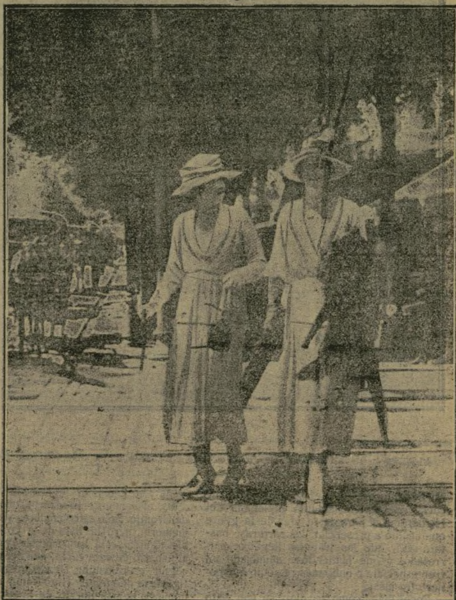
S. M. la Reina Doña Victoria paseando por las calles de San Sebastián, acompañada de la Infanta Doña María Luisa.