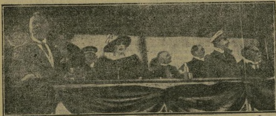
La tribuna regia durante el acto de botar al agua el trasatlántico «Alfonso XIII»

Y ahora, Señor, en nombre del Consejo y en el de todo el personal de mar y tierra de la Compañía Trasatlántica, permitidme expresaros la deuda de gratitud con Vuestras Majestades por su bondadosa asistencia a este acto, y para pagarla y seguir cumpliendo siempre sus patrióticos deberes, no omitiré medio que garantice el que la nave que lleva vuestro augusto nombre sea siempre digna de él y fiel representante y gestora de los intereses españoles y colabore con las demás naves de la Compañía Trasatlántica a la grandeza de la Patria, respondiendo todos sus actos a las divisas: «Por España y por el Rey», que llevamos todos grabadas en el corazón»