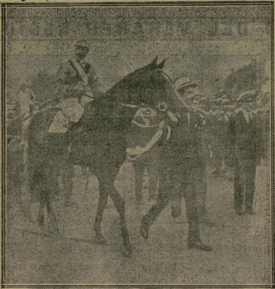
El Monarca llevando de la brida a su caballo «Brabant», ganador del «Gran Premio».