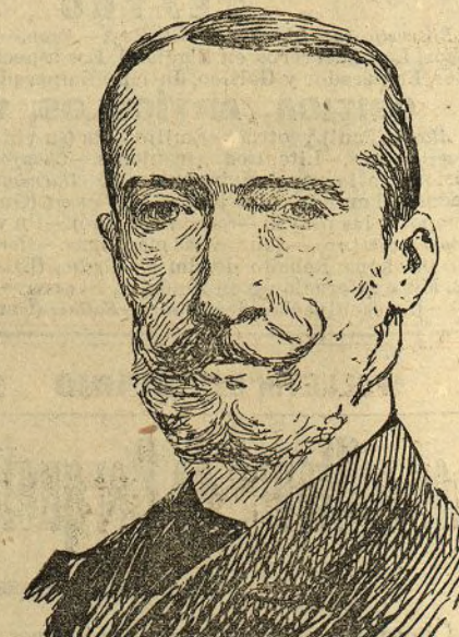
El marqués de Laurencin

Con frase elocuente indica los méritos del nuevo académico y hace un estudio de sus principales obras, deteniéndose en consideraciones atinadísimas sobre El catolicismo de Fernando VII en Valencia , La misión diplomática de Madrid en Viena , Los árabes en las vicisitudes del Dos de Mayo de 1808 , La Jarreria , El matrimonio de Estado , y sobre todo, en la discutida, pero no por eso menos verdaderamente notable, acerca de El Principado de Asturias , discutida en cinco volúmenes, en las revistas