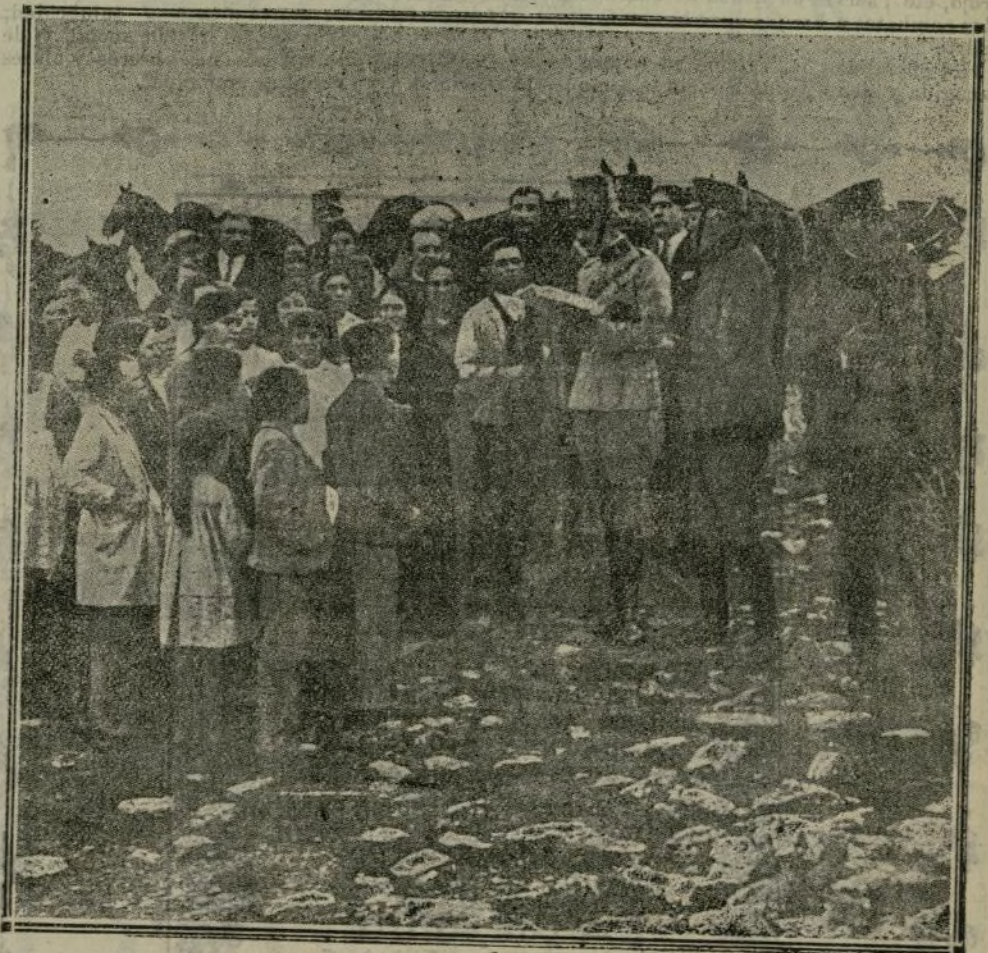
Nota interesantísima de la simpática llaneza con que S. M. el Rey aparece siempre junto al pueblo. Este le rodea durante un descanso en las maniobras militares celebradas en Santa Maria de Nieva (Segovia)