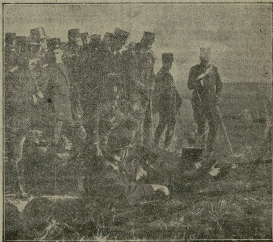
He aquí un momento interesante de las maniobras que el Regimiento del Rey ha efectuado en Guadarrama hace pocos días. S. A. R. el Principe de Asturias aparece en su trinchera disparando el fusil. La educación militar que el Soberano quiere dar a sus augustos hijos tiene simpática manifestación en el acto de referencia.