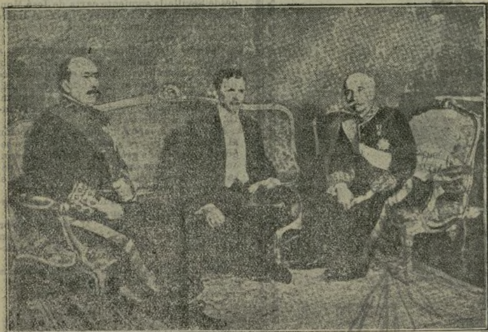
El Embajador alemán, con el Sr. Dato y el Ministro de Estado, durante la visita oficial.

de caluroso encomio para nuestro Soberano por su actuación humanitaria durante la guerra. Realmente, la piedad de Don Alfonso XIII no distinguió a unos de otros beligerantes; los midió por igual ante la desgracia, y así como supo conservar a su nación neutral ante la contienda, supo derramar en la misma medida, sin distinciones ni parcialidades, el bien y la generosidad, el consuelo y la ayuda de que tan pródigo es su corazón de Rey. A Alemania le cupo su parte en aquella obra bienhechora de Don Alfonso XIII y, por boca de su embajador, nos da ahora la satisfacción de consignar su gratitud. España agradece a su vez semejantes manifestaciones y hace votos por el resurgimiento del pueblo alemán.