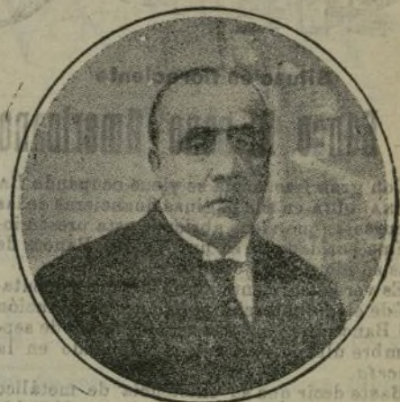
D. Guillermo Capdevila, Subdirector general de Correos.

Al VII Congreso Postal, de Madrid, han concurrido delegaciones de todos los países. En medio de la mayor cordialidad, los señores congresistas proyectaron una nueva legislación del Correo universal, basada, entre otros conceptos, en el respeto absoluto a la carta viajera, en la simplifica-