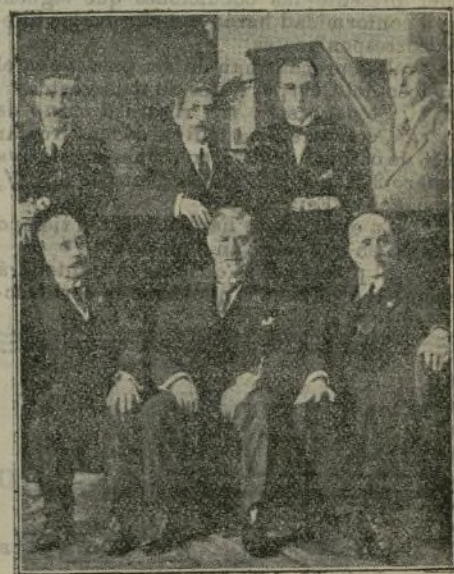
La Delegación española en el Congreso Postal.