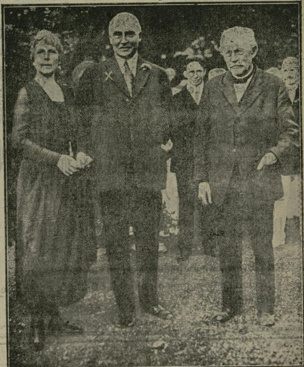
Mr. Warren Harding (x) nuevo Presidente de la República norteamericana, con su esposa y su padre.

C'est clair que les bénéfices sont, désormais, pour les nations belligères, mais ils reviendront, en conséquence, à améliorer les relations commerciales de l'Europe et de l'Amérique. Il ne se passera longtemps sans que l'ingonito qui représente l'élection de M. Harding sera éclairci et c'est à dési-