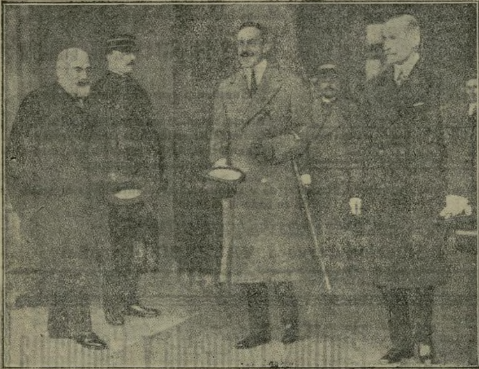
S. M. el Rey D. Alfonso XIII (x) al salir de la estación del Quai D'Orsay de París.

En aquellas horas España estuvo espiritualmente al lado de la nación hermana. No volvió jamás sus ojos a nuestro hogar sin que encontrase en él la solicitud y el cariño junto a la demanda servida. Las