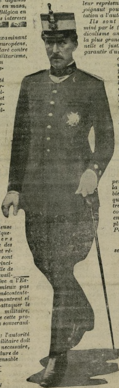
ALBERTO I DE BÉLGICA, CORONEL DE ESPAÑA

La condesa de Romanones va a ser objeto de un homenaje público. Los que conocen las virtudes preclaras de la ilustre dama sentirán confortado su ánimo por el suceso. La condesa de Romanones ha dedicado su vida a la práctica del bien. Numerosas instituciones de caridad reciben impulso y encuentran apoyo en la generosidad inagotable de la condesa. La estirpe castellana de esta dama no se complace con el exhibicionismo que suele acompañar a la beneficencia en uso. La condesa de Romanones ha rehuído, en cuanto se lo ha permitido su preeminencia