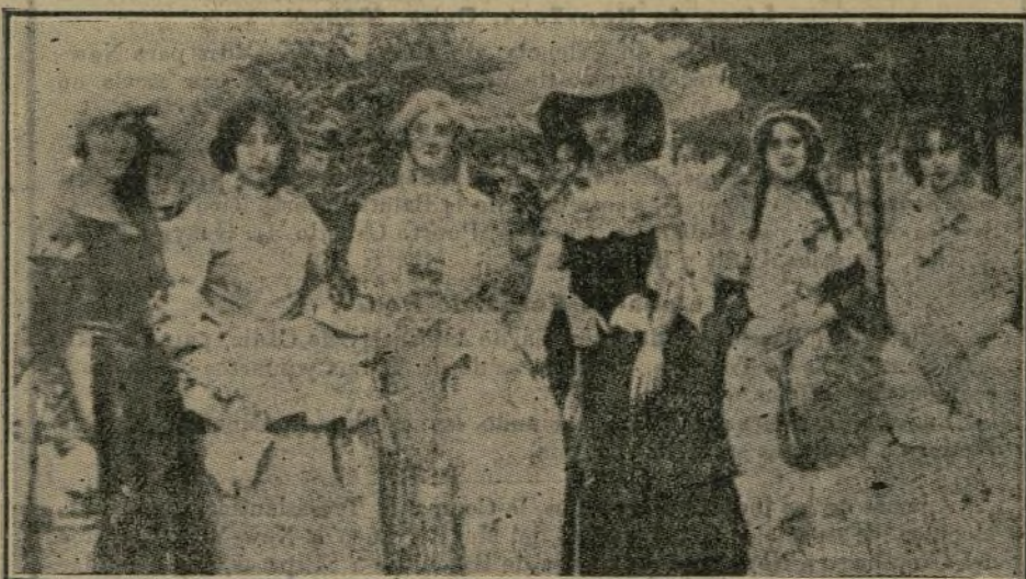
Bellas señoritas de la aristocracia, que representaron cuadros plásticos en una función celebrada por las damas catequistas, y a la cual asistieron la Reina doña María Cristina y S. A. R. la Infanta doña Isabel.