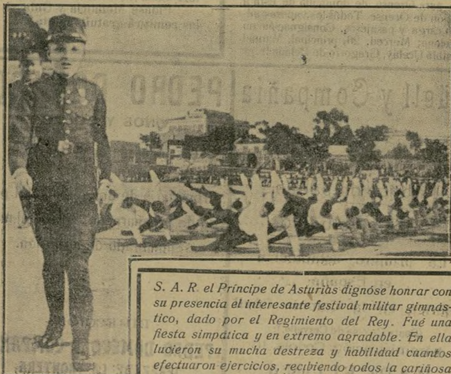
S. A. R. el Príncipe de Asturias dignóse honrar con su presencia el interesante festival militar gimnástico, dado por el Regimiento del Rey. Fue una fiesta simpática y en extremo agradable. En ella lucieron su mucha destreza y habilidad cuantos efectuaron ejercicios, recibiendo todos la cariñosa felicitación de Su Alteza.