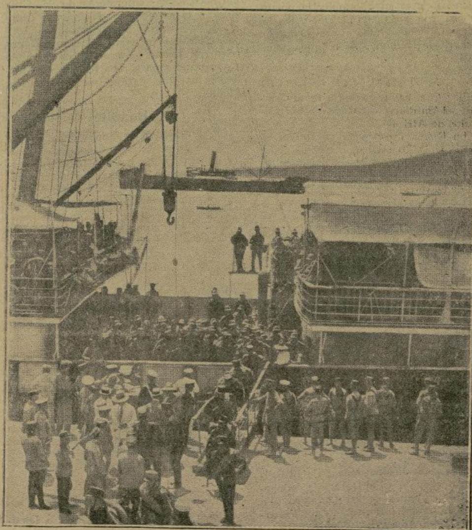
Aspecto del muelle de Melilla durante el desembarco de los soldados de Intendencia.