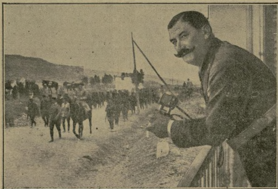
El general Berenguer presenciando desde un balcón el avance de las columnas.