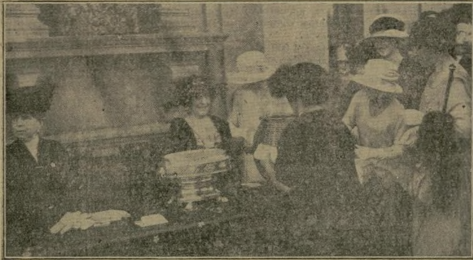
S.S. M.M. las Reinas D. a Victoria y D. a María Cristina con S.S. A.A. las Infantas doña Beatriz y D. a Cristina, vendiendo papeletas en la tómbola benéfica del Gran Casino de San Sebastián.