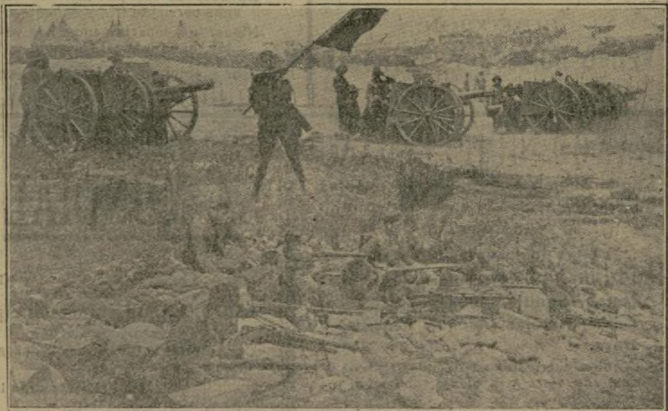
SOLDADOS DE INFANTERIA Y ARTILLERIA PROTEGEN CON TENAZ DENUEDO EL AVANCE DE UN CONVOY DE PROVISIONES Y MUNICIONES PARA LAS POSICIONES DE TISZA Y SIDI-AMARAN, CONVOY QUE FUÉ ATACADO FURIOSAMENTE POR LOS MOROS

El ministro ofreció estudiar con interés el asunto.