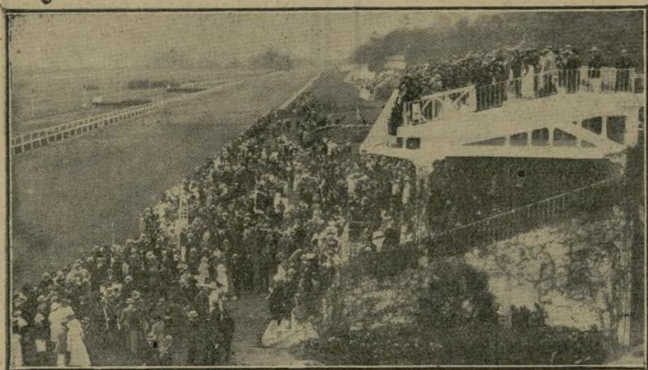
Aspecto del Hipódromo de Lasarte, en las carreras del domingo último.

La tarde del domingo fué una de las grandes tardes del Hipódromo; 727 automóviles y 73 coches se alinearon en la explanada.