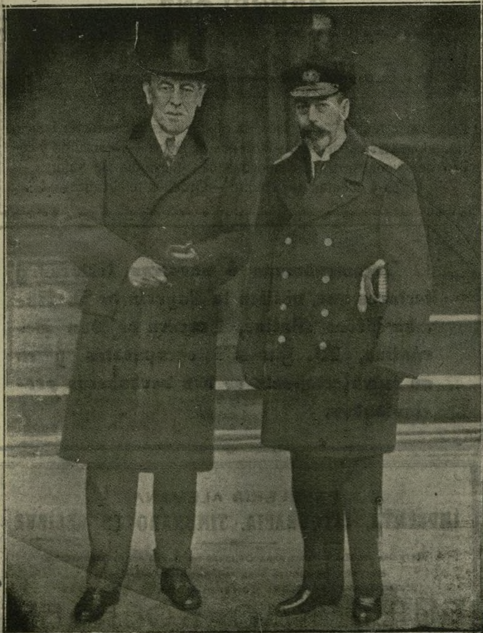
Fotografía obtenida del Presidente de los Estados Unidos con el Soberano inglés al salir el primero de Londres para regresar a París