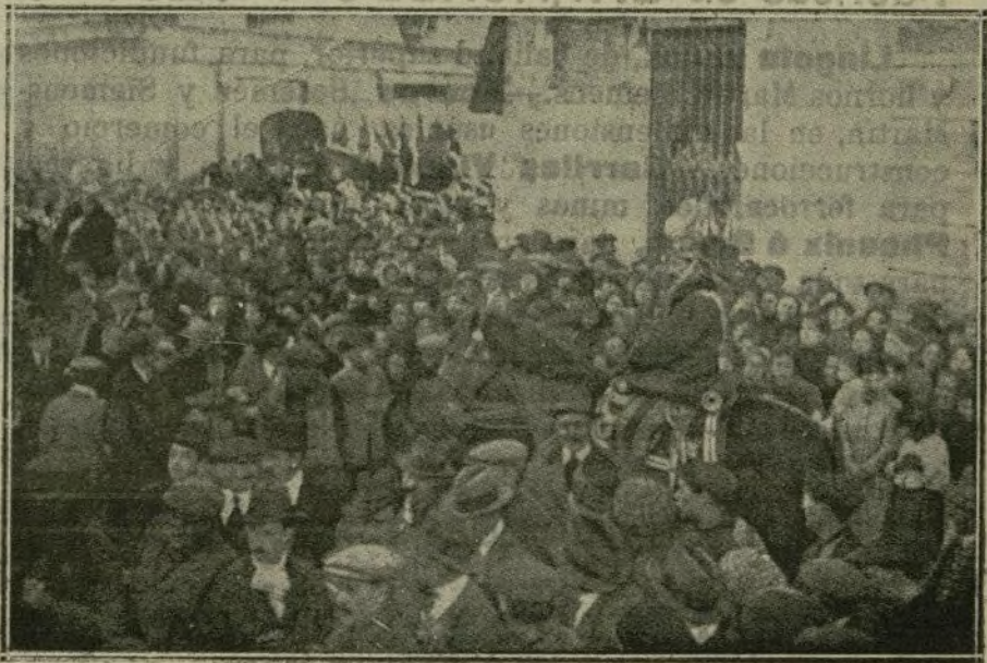
Momento de ser descubierta la lápida dando el nombre de paseo de Fabra y Puig a la Rambla de Santa Eulalia, acto que se celebró por la iniciativa de los obreros de las Hilaturas de Fabra y Coats, en honor de sus patronos.

El acto empezó a las once en punto de la mañana: a la entrada del Paseo se erigió una tribuna, decorada con banderas y