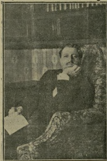
El marqués de Villaviciosa de Asturias, autor del libro «Política al alcance de todos».

A los pocos días de publicar el marqués de Villaviciosa de Asturias su libro Política , vióse en la necesidad de hacer una segunda