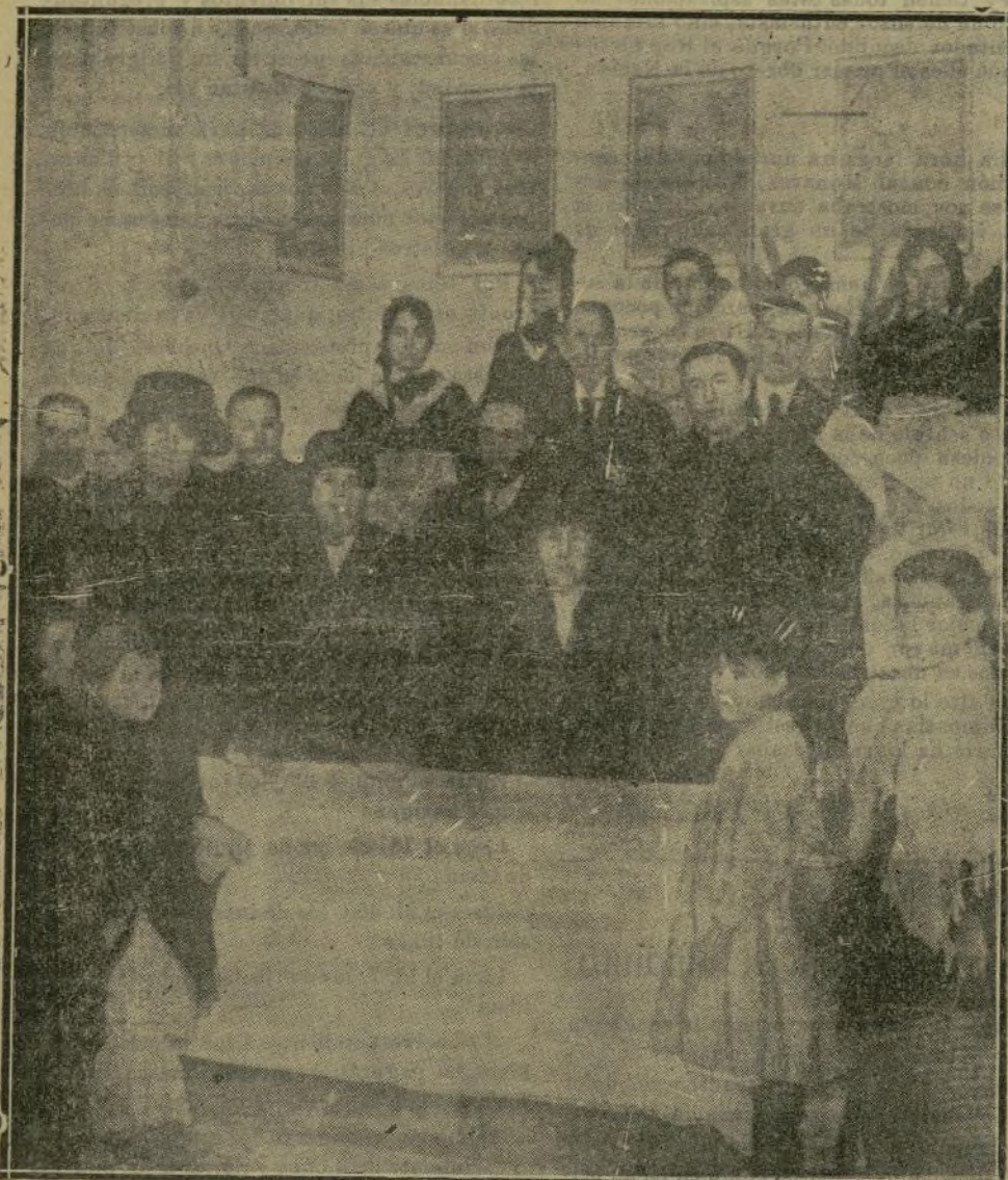
S. M. la Reina Doña Victoria (X) presidiendo un reparto de raciones a los pobres en el Colegio del Sagrado Corazón de Jesús.