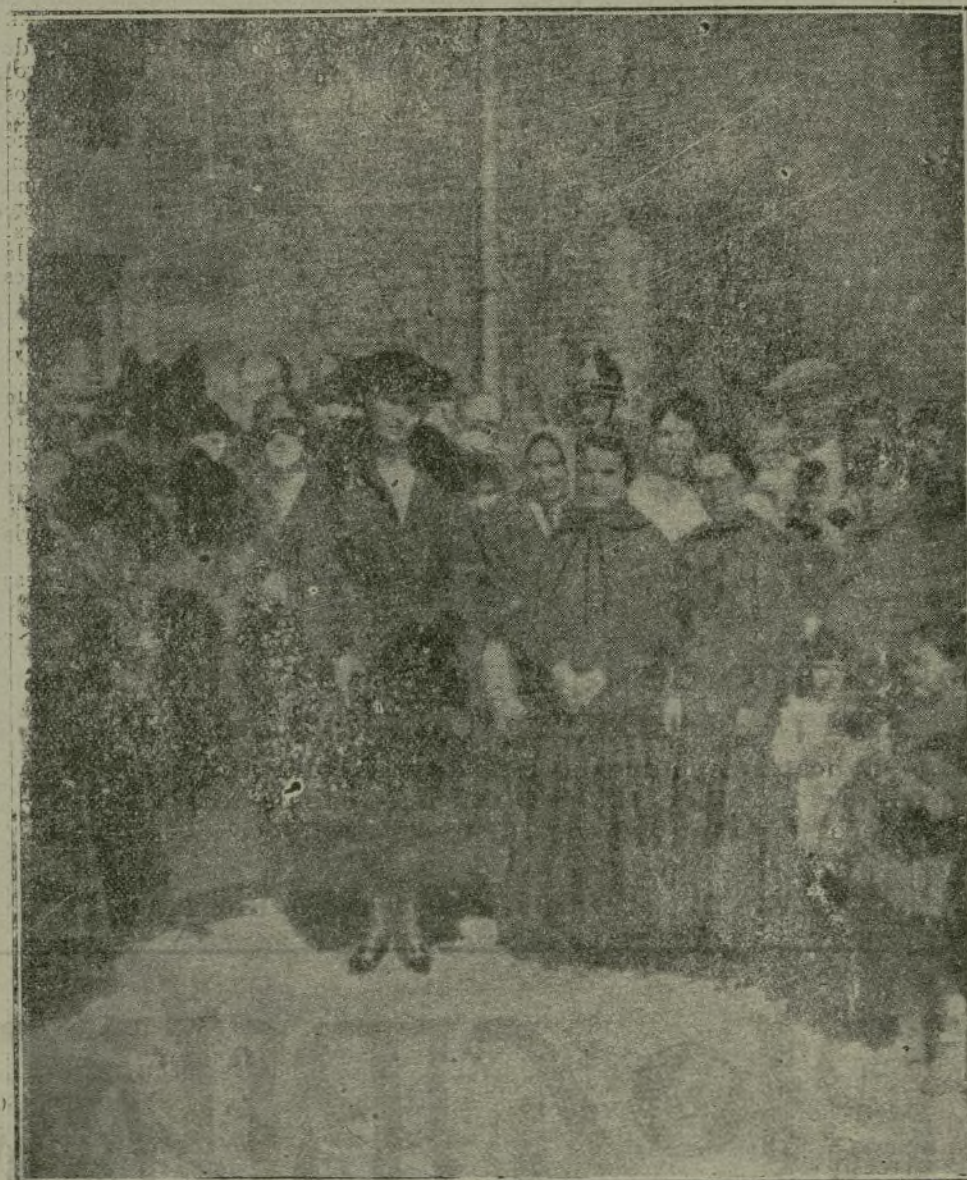
S. M. la Reina Doña Victoria con su augusta madre la Princesa Beatriz, en el reparto de raciones de comida a los pobres en el convento de las Trinitarias de la Guindalera.