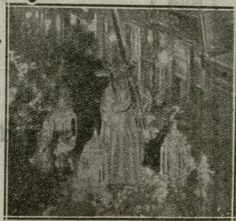
La imagen de Nuestro Señor del Gran Poder, a su paso por la calle de las Sierpes a las tres y media de la madrugada del Viernes Santo.

De nada sirvieron los famosos rumores de una pandilla de «patosos», como aquí se dice, acerca de la salud pública. Las