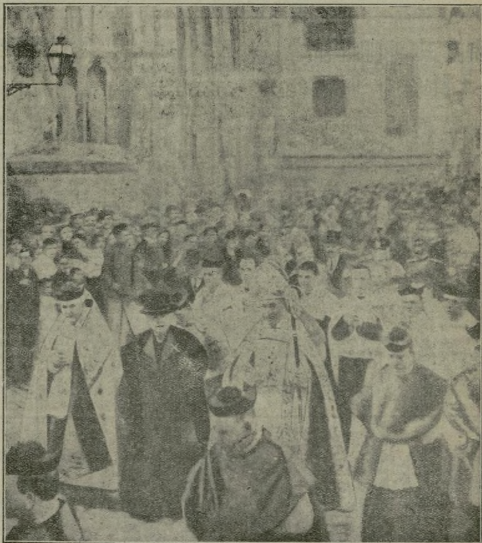
S. A. R. la Infanta Doña Isabel (X), acompañada del Arzobispo de Burgos dirigiéndose a visitar el templo de la Patrona de Valencia