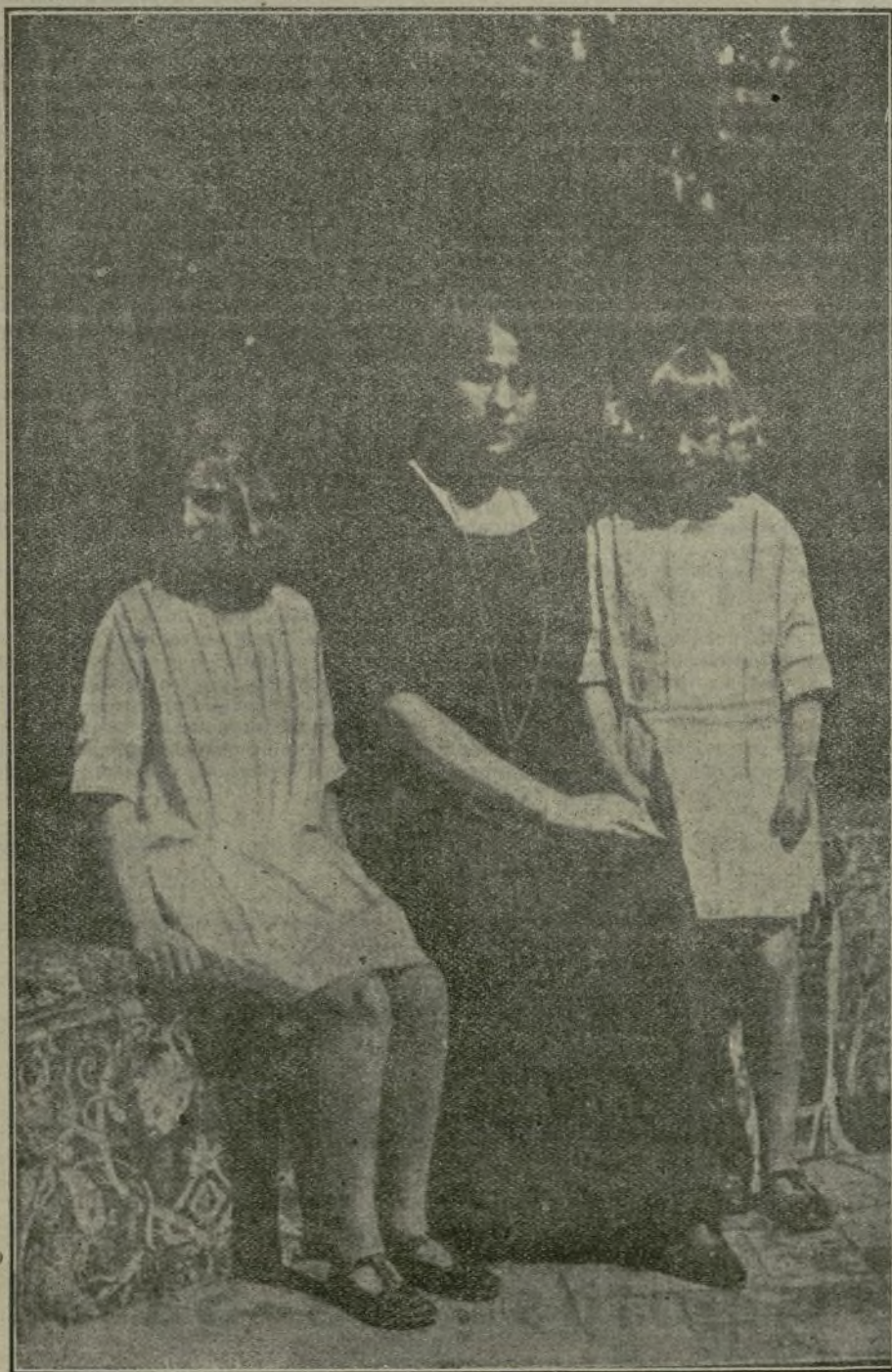
S. M. la Reina Doña Victoria ha permanecido en la hermosa capital andaluza unos días, acompañada de sus augustas hijas SS. AA. RR. las Infantas Doña Beatriz y Doña Cristina. Durante su estancia, la Soberana, ha sido objeto de grandes manifestaciones de afecto del pueblo sevillano y las Infantas se han dignado honrar con su presencia gentilísima algunos festivales infantiles. El presente grabado reproduce un momento en el paseo de S. M. y A.A. por los jardines del Real Palacio.