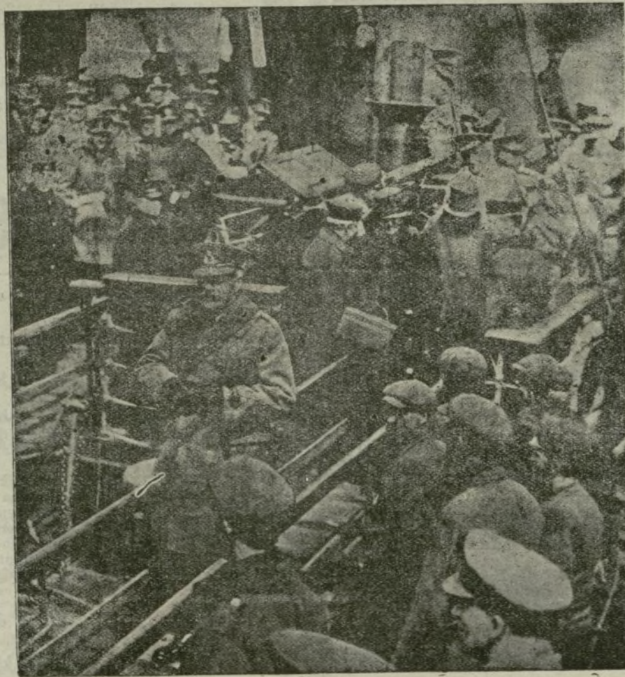
Mr. Douglas Haig, generalísimo del ejército inglés, que en unión del mariscal Foch tanto cooperó a la victoria de los aliados, desembarca, a su regreso de Francia, en Folkestone. Es otro de los héroes a quienes los pueblos victoriosos deben inolvidable gratitud; otra de las glorias militares de Inglaterra, destacada con motivo de la causa que juntó a Inglaterra con Francia, Norte América, Rusia e Italia, en fuerte comunidad de hombres y de ideas.

Mañana domingo, festividad de la Santísima Trinidad, no habrá capilla pública en Palacio por marchar el Monarca a Segovia ese día, con objeto de visitar la Academia militar y hacer entrega de los Reales despachos a los nuevos oficiales de artillería.