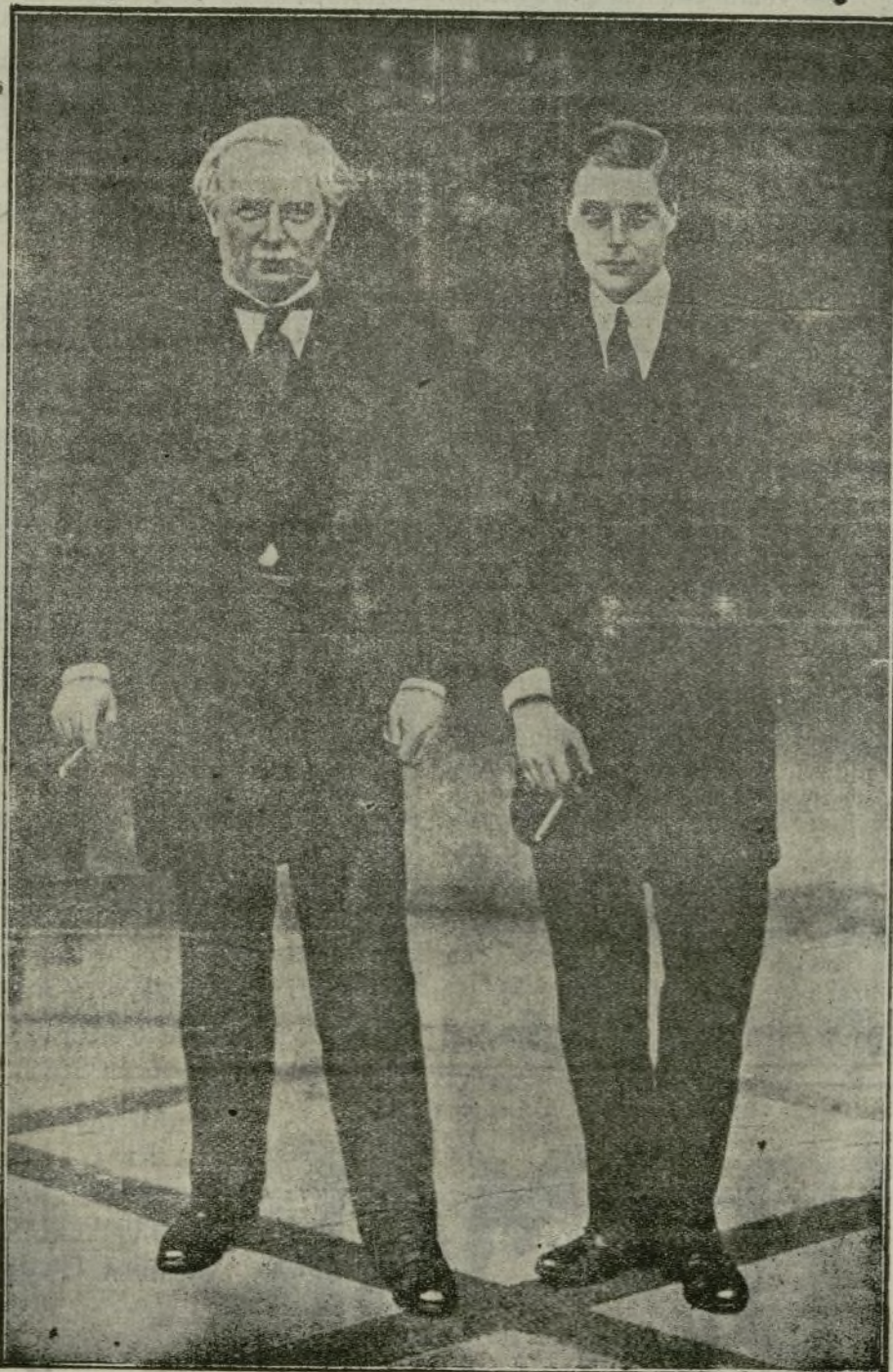
El Príncipe de Gales, acompañado de Lloyd George, visitando el Parlamento inglés.