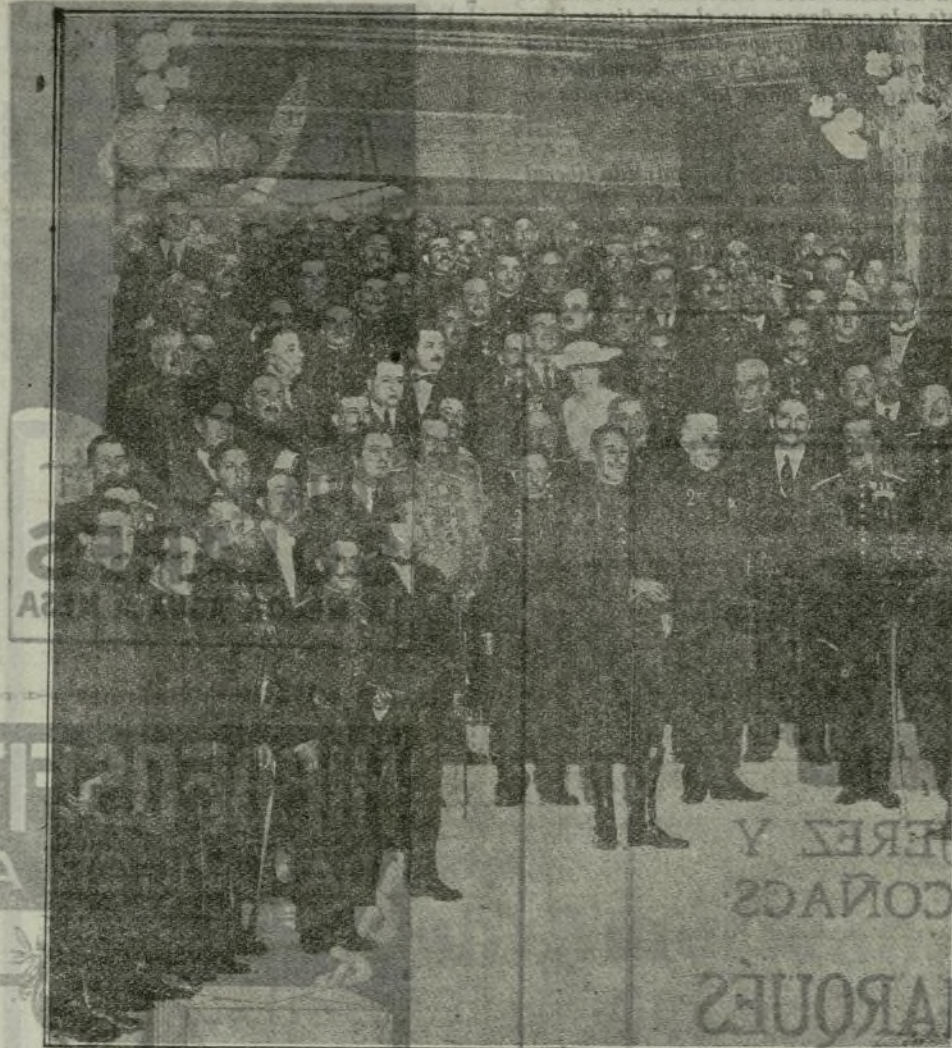
El Soberano (1) con el ministro de la Guerra (2), el general Weyler (3) y demás concurrentes al banquete de los jefes y oficiales de la Escala de reserva.

No nos basta todo esto para considerarnos satisfechos al realizar este acto. Queríamos más, y tenemos la firme convicción de haberlo conseguido. Por qué tan ardorosamente hemos suplicado asistieran a los señores ministros de la Guerra y de Marina? ¿Qué significa que se encuentren entre nosotros las autoridades superiores del Ejército y de la Armada en esta corte? Pues queremos que su presencia realzara la honda significación de este acto, que lo presiden el amor intenso a la Patria, honra e incommovible adhesión a nuestro Rey y una prueba elocuentísima y profunda de que los humildes procedentes