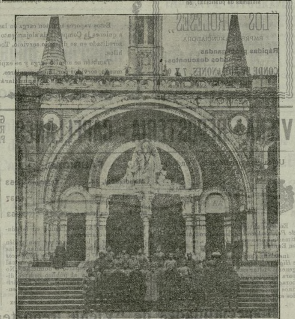
Entre las personas reunidas ante la puerta de la catedral de Lodzina, figura el general polaco Haller, que ha de operar contra los bolcheviques. Estos, que en Rusia sufren derrotas, amenazan con invadir los pueblos de Europa y América; pero la organización social de los pueblos cultos ofrece una barrera potente al avance bolchevique más o menos disciplinado, y esta reacción ante el peligro nuevo hace esperar que no prospere gran cosa esa doctrina inhumanitaria nacida en Rusia.