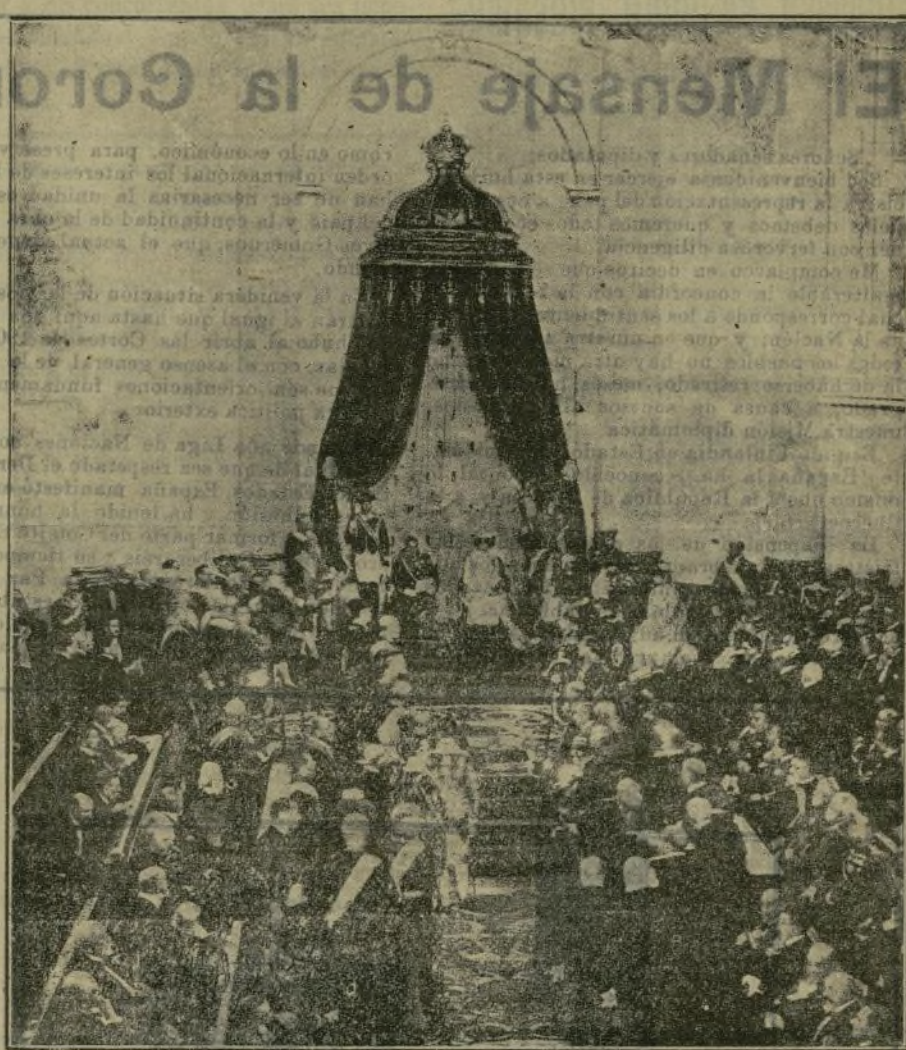
El salón de sesiones de la Alta Cámara durante la apertura de Cortes.

Si no responde como debe, suya será la responsabilidad en la demora que sufra la resolución de los problemas sometidos a su examen.