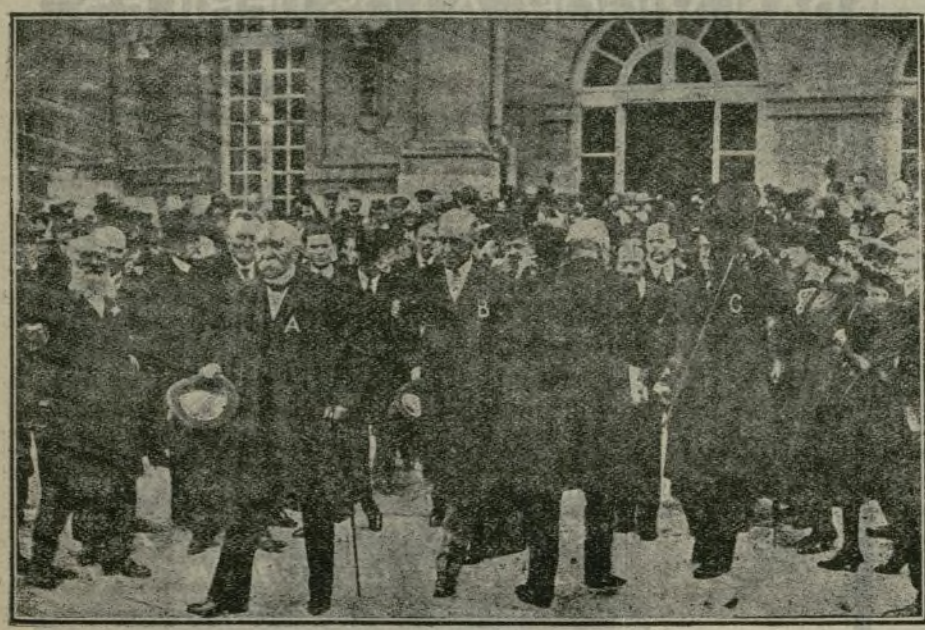
Clemenceau (A), Wilson (B) y Lloyd George (C) al salir del Palacio de Versalles después de la firma de la paz.

Elle a pour berceau La Ligue des Nations. Pouvait il se produire un fait plus grand, plus fort, plus juste et meilleur? Non; la Ligue des Nations, c'est la solution des conflits entre les Etats, c'est le juge qui règle une affaire entre les hommes de différente race, c'est le juge qui condamne ou bien acquitte, en un mot, la Ligue des Nations, c'est l'abolition de la guerre. Pour terminer, la Ligue des Nations, c'est la fraternité entre les peuples, c'est éviter de tels et nouveaux conflits, et, c'est pourquoi, nous saluons, en la personne du président Wilson, promoteur de cette généreuse institution, l'apôtre de la paix universelle, et, puissent l'écho de nos paroles à lui adress