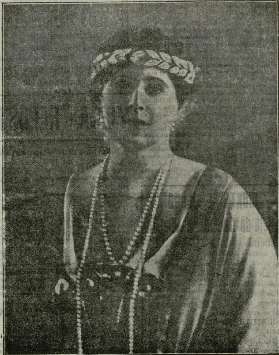
La Soberana María de Rumania.