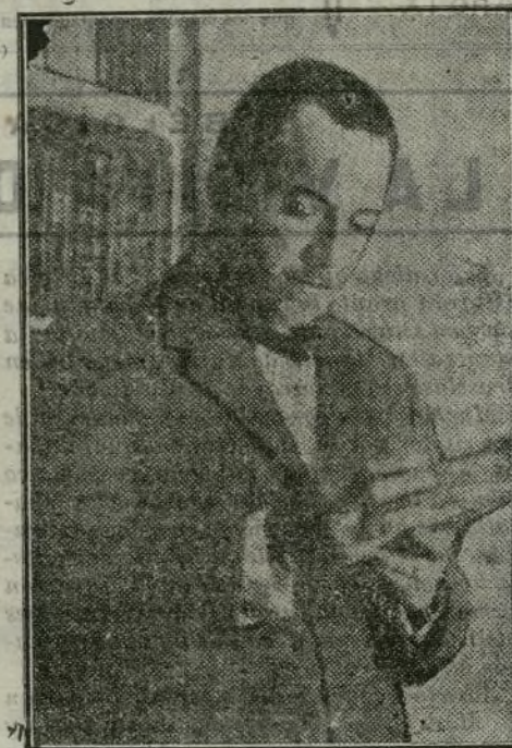
El diputado a Cortes por Vilademuls, don Francisco de Moxo y de Semmenat.

el gran patriota Sr. Sala, hizo su primer llamamiento, apresuróse el Sr. Moxo a formar parte de ella con el entusiasmo con que antes hubo de mirar la «Lliga Patriótica» de Barcelona.