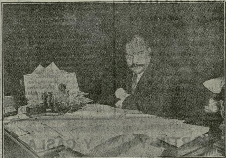
D. José Montesinos Checa, subsecretario de Hacienda, en su despacho del Ministerio.

Sus aptitudes son evidentes y lo demuestra colaborando y auxiliando al ministro en sus tareas y en sus planes financieros. En el pasado empréstito trabajó activamente y segu-