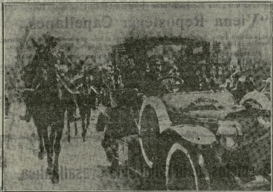
El coche Real que conducía a S. M. la Reina Doña María Cristina, al pasar por la Avenida, en San Sebastián

La ciudad mostrábase regocijada ante el grato suceso. Colgaduras, tribunas adornadas con gusto, flores para sembrar el recorrido del coche Real, cohetes que alegraron el