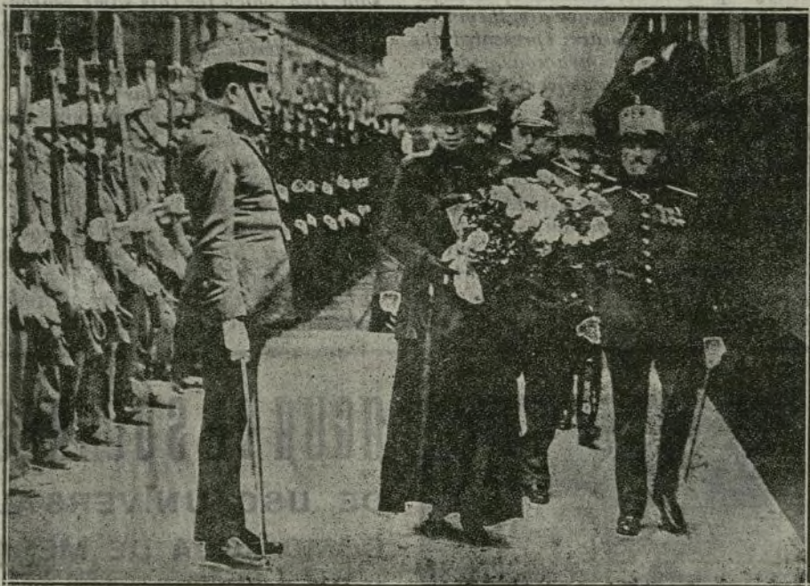
La Reina Doña María Cristina revistando la tropa que le rindió honores a su llegada a San Sebastián.