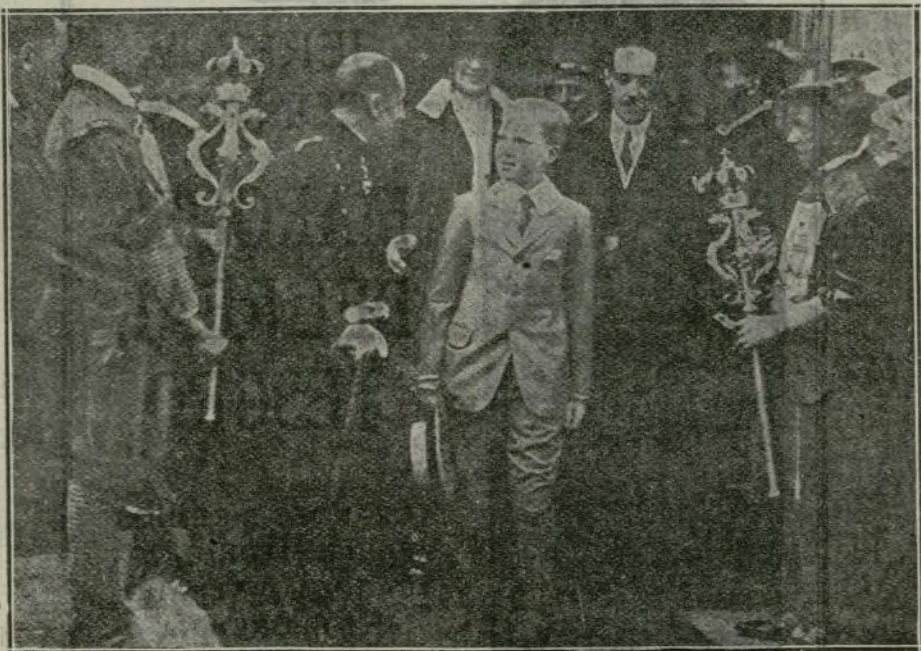
La Soberana y el Príncipe de Asturias al llegar a la capital montañesa.