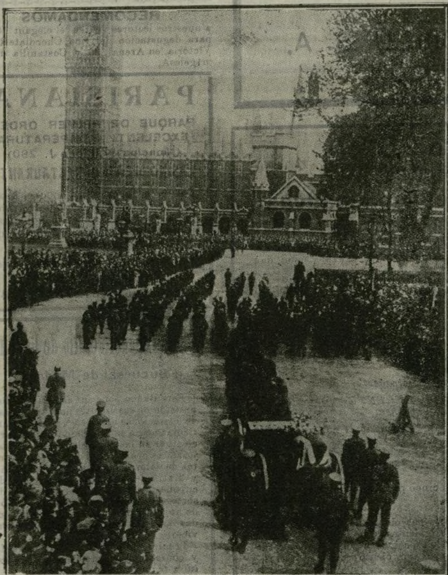
Desfile en Londres de la comitiva fúnebre conduciendo los restos de la heroína Miss Cavell, que fué fusilada en Bruselas por los alemanes por supuesto delito de espionaje. Miss Cavell es una de las mujeres cuya memoria será eterna gloria de su patria, una heroína digna de la palma de los mártires, ejemplo conforante de mujer en medio de los grandes horrores de la guerra que terminó para bien de la humanidad.