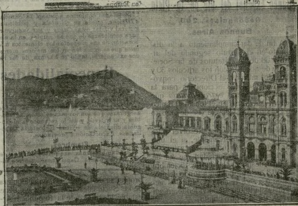
El Gran Casino y el Monte Igueldo.

bién que a San Sebastián, como a Santander, acuden muchos millonarios, pero éstos, en lugar de dificultar la vida de los demás, lo que hacen es favorecer al Comercio y a la Industria donostiarra. Sin estos millonarios extranjeros que dejan su dinero aquí y sin las clases aristocráticas de España, ¿podrían San Sebastián y Santander competir tan ventajosamente con las mejores playas de Europa?